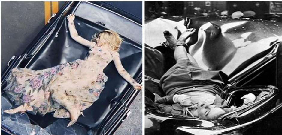
Resim 1. Hadise’nin Klipteki Görüntüsü (Solda) Evilyn’nin İntiharı (Sağda)

Hay Hay Klibi özelinde incelemeye aldığımız göstergeler temelinde en güzel intihar olarak bilinen Evilyn Francis’in intihar olayına gönderme yapıldığı tespit edilmiştir. Evilyn Francis Mchale muhasebeci olarak çalıştığı Empire State binasının 83. katındaki Gözlem Güvertesinden, (yaklaşık 255 metre) atlayarak hayatına son vermiştir. O sırada olay yerinden geçmekte olan bir fotoğrafçılık öğrencisinin objektifinden “tarihin en güzel intihar” olarak bilinen o fotoğraf çıkmıştır. Evilyn’in intihar görüntüsü şaşırtıcı şekilde hiç bozulmamış, sanki hurda bir arabanın üzerinde uyuyan bir kadın imajı vermiştir. Nişanlısının baskıları ve kendisini iyi eş, anne adayını göremediği için, yaşamış olduğu buhranlı günlerinin sonucunda intihar ettiği düşünülmektedir. Bu bağlamda Hadise’nin “Sadece kendine yenilen kadınların hikayesi...” “Kim bilir belki de en güzel intihar etme şekli aşık olmaktır” şeklinde açıklamalarının ardından; hayatı savaşmakla, mücadele etmekle geçen tüm kadınların hikayesi... Yorulmadan yürüyen, yere düşse bile kendi gücü ile ayağa kalkan sadece kendine yenilen kadınların hikayesi...” şeklindeki açıklamaları da bu tespiti desteklemektedir ( https://siradisidergisi.com/tarihin-en-guzel-intihari/ ).