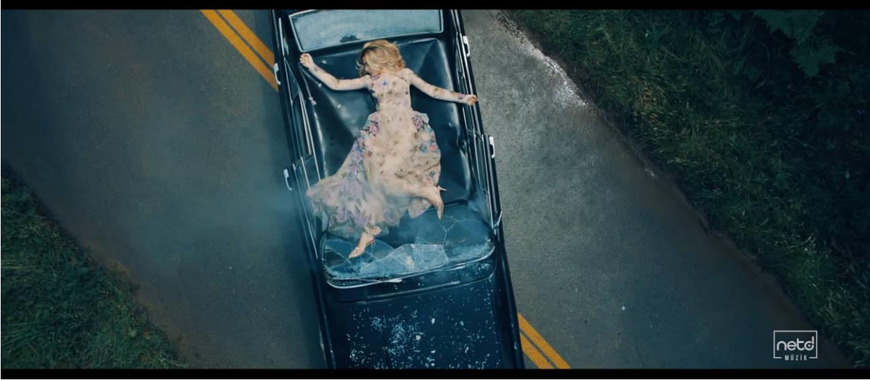
Resim 2. Klibin Girişi

Klibin giriş bölümündeki görüntüde Evely'nin intiharına net bir şekilde atıf yapılmıştır (Resim 2). Devamındaki sahne ise Hadise'nin uyanıp arabanın üzerinden inmesi ile devam etmektedir. Yol boyunca yoğun gün ışığının arasında yürüyen Hadise'nin, gideceği yer klip içerisinde 2.25 dk'da gösterilmektedir. Bu yer yüksek bir bina olarak görülmektedir (Resim 3).