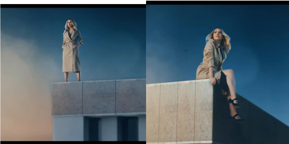
Resim 5. Hadise'nin bina üzerinde güçlü kadın imajı veren duruşu ( https://www.youtube.com/watch?v=26xNHZzGJZI )

Görüntüde yer alan bina yine Evilyn Francis'in atladığı Empire State binası ile benzerlik göstermekte ve gerçek olaya atıf yapılmaya devam edilmektedir. Bu bağlamda bina gönderme olarak kullanılmıştır (Resim 4). İlerleyen sahnelerde Hadise, aynı binanın merdivenlerinden çatıya çıktığı görüntülerde aşağıya atlamadan önce kendi deyimiyle “sadece kendine yenilen güçlü kadın” imajını yansıtan görüntüye yer verilmektedir (Resim 5).