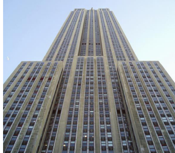
Resim 4. Evely'nin atladığı Empire State binası ( https://www.youtube.com/watch?v=26xNHZzGJZI )

Görüntüde yer alan bina yine Evilyn Francis'in atladığı Empire State binası ile benzerlik göstermekte ve gerçek olaya atıf yapılmaya devam edilmektedir. Bu bağlamda bina gönderme olarak kullanılmıştır (Resim 4). İlerleyen sahnelerde Hadise, aynı binanın merdivenlerinden çatıya çıktığı görüntülerde aşağıya atlamadan önce kendi deyimiyle “sadece kendine yenilen güçlü kadın” imajını yansıtan görüntüye yer verilmektedir (Resim 5).