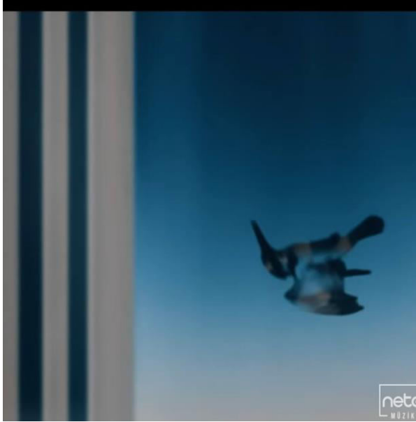
Resim 6. Binadan yere düşen kuş Metaforu ( https://www.youtube.com/watch?v=26xNHZzGJZI )

Öte yandan ironik olarak binanın tepesinden aşağıya düşen kuş metaforu, en tecrübeli veya güçlü kişilerin dahi aşkın karşısında savunmasız kalabileceğini simgelemektedir (Resim 6).