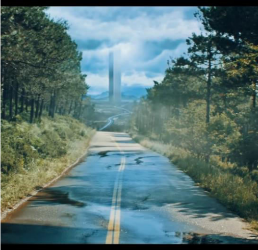
Resim 3. Hadise'nin klibindeki bina ( https://www.youtube.com/watch?v=26xNHZzGJZI )

Klibin giriş bölümündeki görüntüde Evely'nin intiharına net bir şekilde atıf yapılmıştır (Resim 2). Devamındaki sahne ise Hadise'nin uyanıp arabanın üzerinden inmesi ile devam etmektedir. Yol boyunca yoğun gün ışığının arasında yürüyen Hadise'nin, gideceği yer klip içerisinde 2.25 dk'da gösterilmektedir. Bu yer yüksek bir bina olarak görülmektedir (Resim 3).