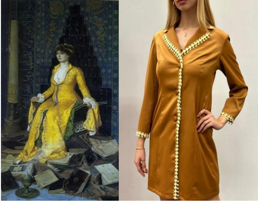
Görsel 1. Osman Hamdi Bey, Mihrap (Yaratılış), Tuval Üzerine Yağlıboya, 210x108 cm., 1901 ( https://twitter.com/tablofelsefe/status/1174335589019279361 (Erişim Tarihi: 06.04.2023))