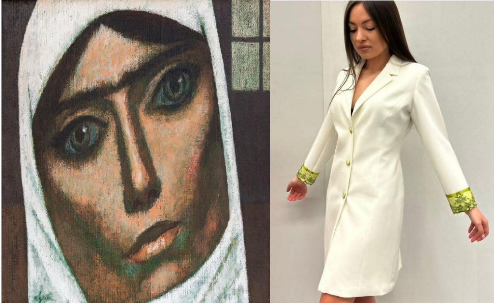
Görsel 5. Nuri İyem- Türkmen Kadın, Tuval Üzerine Yağlıboya, 1976, 35x45cm,