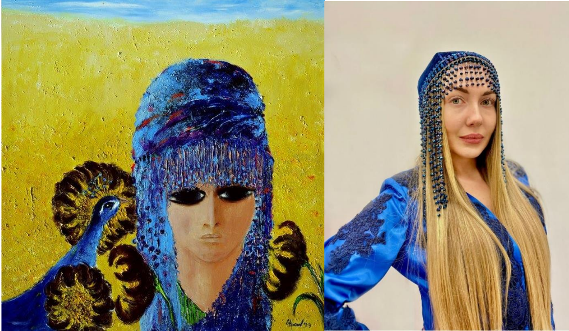
Görsel 14. Fikret Otyam, Otyamın Fırçasından, Tuval Üzerine Akrilik, 1999

Fikret Otyam, 1926 senesinde Aksaray'da doğmuştur. Gençliği ve çocukluğu Aksaray'da geçmiştir. Sanat yatkınlığı olan bir aileden gelen Otyam, müzikle, edebiyatla alakalı bilgileri aileden kazanmıştır. Sanatçının ilgisi toplumsal konularda olmuş ve bu tarz kitap, dergi okumuştur. Çocukluğunda babasının eczanesinde ona yardım etmesi insanları daha yakından tanıyıp gözlemlemesine katkı sağlamıştır. O zamanlarda Otyam, eczaneye gelenlerle ilgili izlenimlerini ve yaşadıklarını günlükte not tutmuştur (Otyam, 1997:15). 1945 yılında, Fikret Otyam, İstanbul Güzel Sanatlar Akademisi'ne kabul alarak resim eğitimine burada başlamıştır. Akademi'de ilk senelerde Çallı'nın atölyesinde eğitim alan sanatçı, ardından Bedri Rahmi Eyüboğlu'nun atölyesine devam etmiştir. Bedri Rahmi Eyüboğlu'nun atölyesine geçmesiyle beraber içerik yönüyle daha özgür bir çalışma imkânı yaratmıştır (Otyam, 1997: 37).