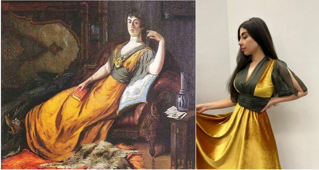
Görsel 3. Halife Abdülmecid, Haremde Goethe, Tuval Üzerine Yağlıboya, 132x173 cm., Ankara Devlet Resim ve Heykel Müzesi, 1898/1917( https://www.kulturportali.gov.tr/portal/abdulmecid-efendi Erişim Tarihi: 25.03.2023)