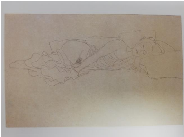
Resim 2 (Soldaki). Gustav Klimt, “Uzanan Çıplak”, 34.9x55.1 cm, 1904, Viyana Tarihi Müzesi, Viyana. Kaynak: Burn, B., vd. (2001), Gustav Klimt: Modernism in the Making