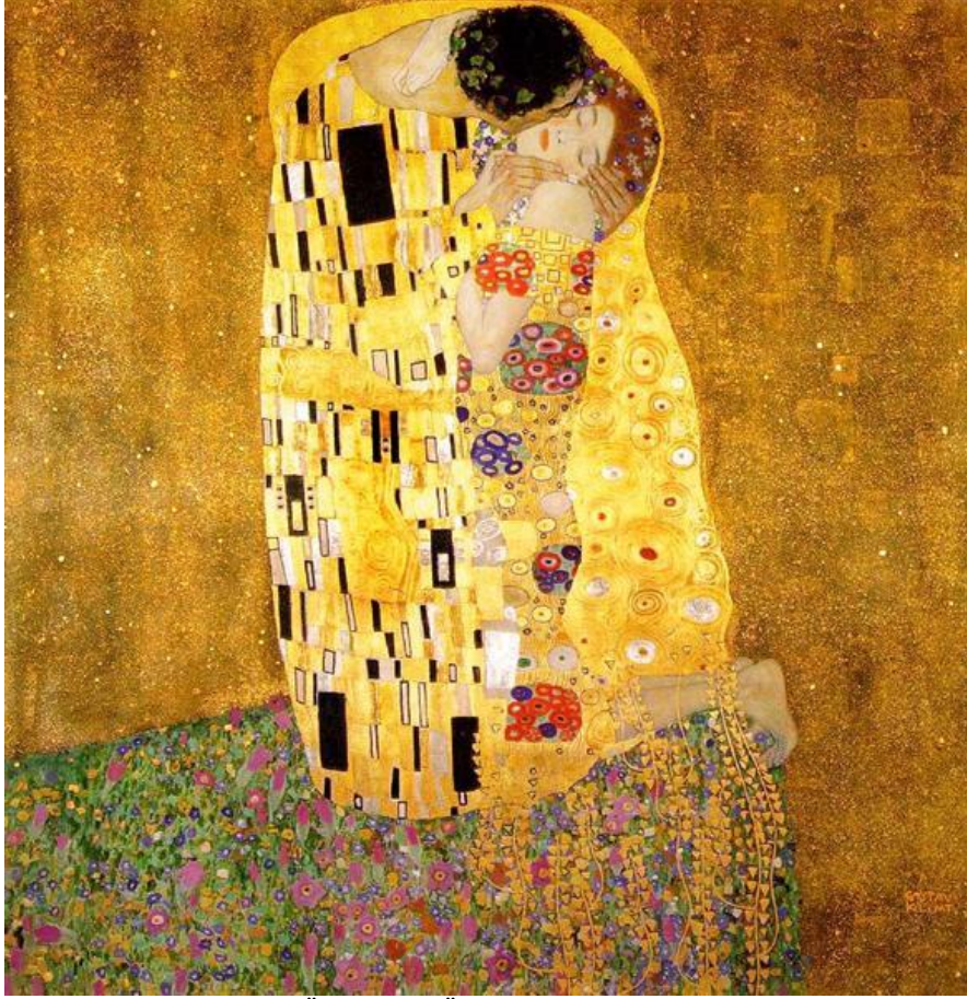
Resim 4. Gustav Klimt, “Öpücük”, TÜYB, 180x180 cm, 1907-1908, Belvedere, Vienna, Austria.