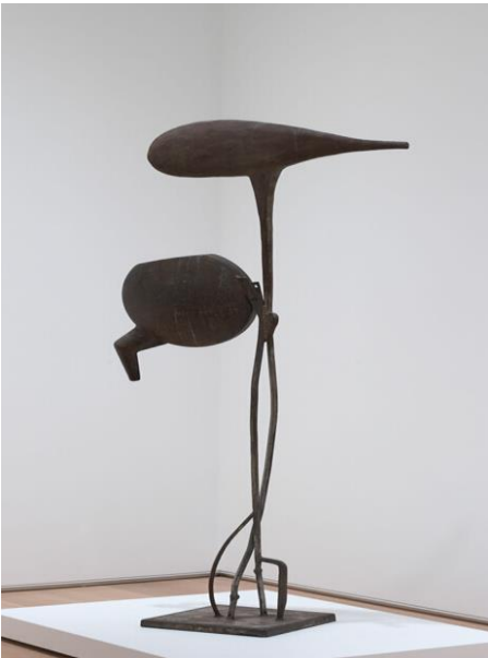
Görsel 3: Tanktotem David Smith

1952 yılının çalışmaların da sanatçı totem benzeri figürlerle ilgilenmiştir. Bu tarz çalışmalar yaparken daha çok buluntu nesnelere yararlanan sanatçı diğer çalışmalarına oranla daha az taslak çizim yapmıştır. Sanatçı bu çalışmalarında buluntu makine parçalarıyla ve endüstriyel materyallerle kübist kolaj ve konstrüksiyonun birleştiği bir tür heykel kolajı yapmaya çalışmıştır. “Tanktotem” isimli çalışması sanatçının sayısı 15 den fazla farklı numaralandırılmış serilerinin ilk çalışmalarındandır. Sanatçıya göre, seri tek bir temanın gelişen ya da sistematik keşfi değildir daha çok tekil moda sahiptir. Sanatçı genelde çeşitli serilerin parçaları üzerinde aynı anda çalışmıştır( Fineberg,2014:119).