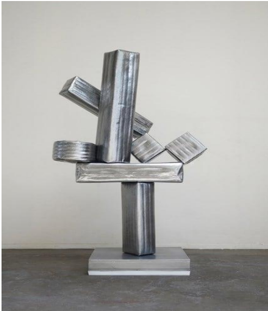
Görsel 5: 'Cubi XXI', David Smith

Bilinçaltından çıkan birçok devinimi eserlerinde hissettiren sanatçı "Cubi" heykel serisinde birçok geometrik formu bir arada kullanarak anıtsal bir etki yaratmıştır. Düzensiz duran geometrik biçimlerle yapısal yeniliği simgeleyen sanatçı geometrik üslubun anlatım gücünden yararlanmıştır.