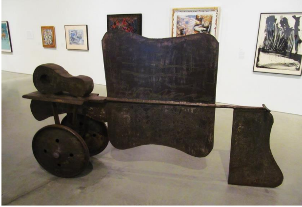
Görsel 4: David Smith Voltri XII

https://www.flickr.com/photos/rocor/28311265515 Erişim Tarihi:23.09.2022