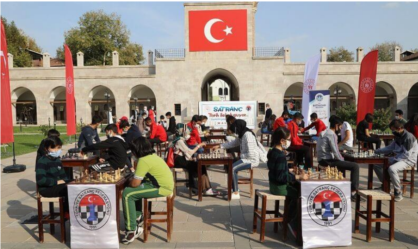
Resim 13. Kervansarayda Satranç Turnuvasından Görünüm.

2020 yılında, Gençlik ve Spor Bakanlığı ve Türkiye Satranç Federasyonu tarafından 29 Ekim Cumhuriyet Bayramı kutlamaları çerçevesinde “Geçmişten Geleceğe Hamle Yapıyoruz” projesi ile Battalgazi’nin tarihi mekânlarında satranç turnuvası düzenlendi(Manşet Malatya “Sporcular Battalgazi’nin Tarihi Mekânlarında Buluştu.”30.10.2020).