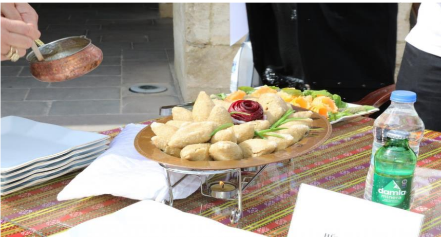
Resim 15. Kervansarayda Vejetaryen Yemek Yarışmasından Görünüm.

Malatya'nın zengin mutfak kültürünün tanınması, unutulmaya yüz tutmuş yöresel yemeklerimizin ortaya çıkarılması ve tespit edilen bu yemeklerin gastronomi turizmi alanında tanıtılması amacıyla Battalgazi Belediyesi tarafından 2022 yılı 8 Mart Dünya Kadınlar Günü kapsamında Silahtar Mustafa Paşa Kervansarayı'nda yarışma yapıldı. Düzenlenen ödüllü "Vejetaryen Yemek Yarışması" ile Malatya'nın vejetaryen mutfağı Battalgazi'de yarıştı. Birinciye yarım altın, ikinciye çeyrek altın, üçüncüye gram altın, dördüncüye ve beşinciye tencere takımı hediye edildi. Yarışmaya katılan tüm katılımcılara çay fincan takımı hediye edildi. Bu yemeklerin gastronomi turizmi alanında tanıtılması amacı hedeflenmiştir(Malatya Flaş Haber"Malatya'nın Vejetaryen Mutfağı Battalgazi'de Yarıştı" 09.03.2022).