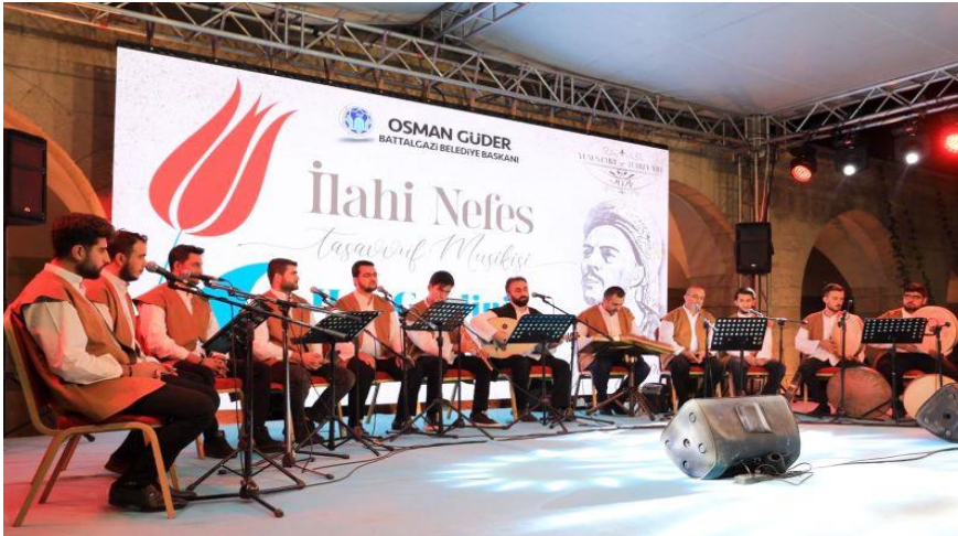
Resim 7. Yunus Emre Anma Etkinliğinde İlahi Dinletisi.

Battalgazi'de 27 Temmuz 2020 tarihi itibarıyla antika severler ve koleksiyoncular için eski ürünlerin sergileneceği antika pazarı, Silahtar Mustafa Paşa Kervan Sarayı'nda hizmete girdi. Her ayın son pazar günü antika meraklıları bir araya gelecektir. Gramofon, semaver, pul, halı, saat, dikiş makinesi, teleskop, kılıç, dönem kıyafeti ve takısı ve benzeri antika vasfı taşıyan eserler getirilmektedir. Bu vesile ile antika vasfı taşıyan eserler değeri ile kıymetlendirilerek sahiplerine takdim edilmektedir (Malatya Son Söz, "İlk Antika Pazarı Kervansaray'da Açıldı" 27.07.2020).