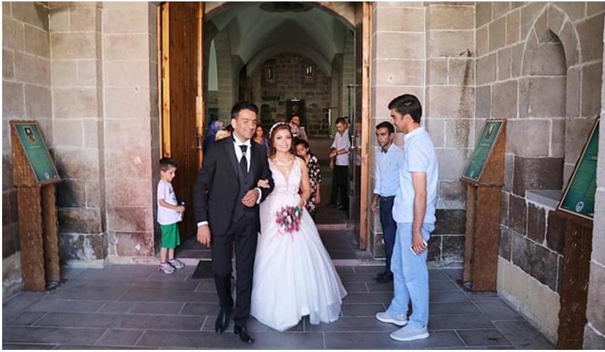
Resim 17. Kervansarayda Nikâh Fotoğrafi Çekiminden Görünüm.

Battalgazi Belediyesi, Silahtar Mustafa Paşa Kervansarayı'nda yapılan organizasyonlarda (Özel günler, Nişan, Düğün, Katalog ve Fotoğraf çekimi ve diğer etkinlikler) ücret tarifeleri oluşturarak kervansarayın giderlerin bir kısmının karşılanması yoluna gitmiştir(Battalgazi Belediyesi 06.10.2020).