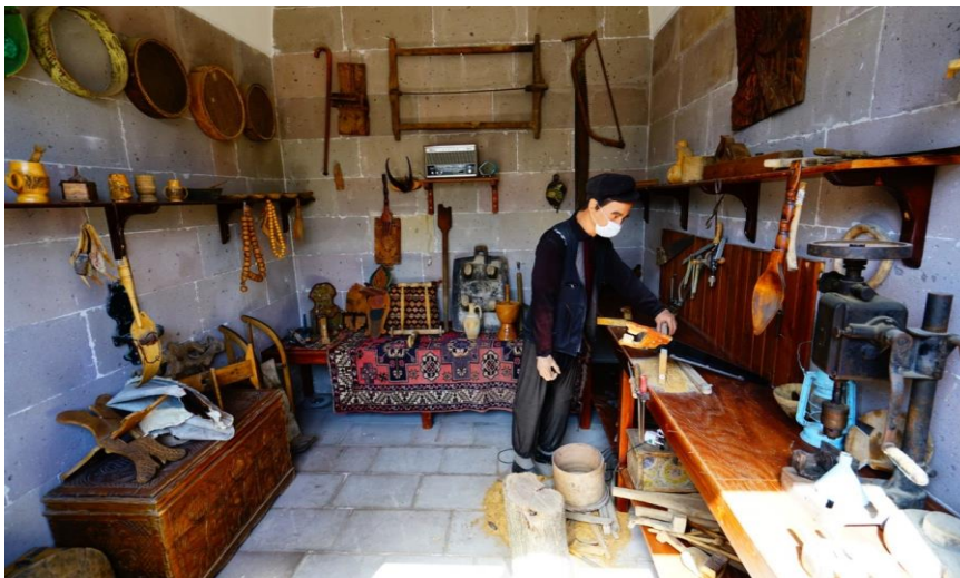
Resim 3. Giriş Kapısı Doğu Cephesi Dükkânlarından Marangoz Atölyesi Aletler ve Usta Heykeli.

Giriş kapısının sağlı ve sollu tonozlu muhafız odasının şimdiki işlevi dokuma ve rölyef atölyesi olarak kullanılmaktadır. Avlunun kuzey ve güney cephelerinde çim alanlar ve güller görülür. Avlu ortasında havuz ve revakların bulunduğu alanın etrafı ise dükkânlar ile sıralanmıştır. Güney ve doğu cephesi dükkânları şu an boş olarak görülmekteyse de faaliyetler yapıldığında etkinliğin türüne göre buralarda kullanılmaktadır. Batı cephesinde ise; çini, çömlek, resim ve karikatür, müzik atölyeleri ile kafeterya bulunmaktadır. Kuzey cephesinde dinlenme alanı ile el sanatlarına ait ürünlerin satışına ait tezgâh görülmektedir.