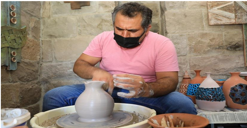
Resim 10. Çömlek Atölyesi.

Battalgazi Belediyesi'nin girişimiyle Silahtar Mustafa Paşa Kervansaray'ında açılan ücretsiz kurslarda; halı, resim, müzik, dokuma, seramik, minyatür, hüsnü hat ve ebru gibi birçok sanatın eğitimi verilerek, halkın katılımına imkân verildi. Düzenlenen kurslar ile istihdama yönelik bu faaliyetler dikkat çekmektedir(Malatya Eksen Haber" Battalgazi Belediyesi'nin Kültür Sanat Kursları Yoğun İlgi Görüyor" 28.07.2021).