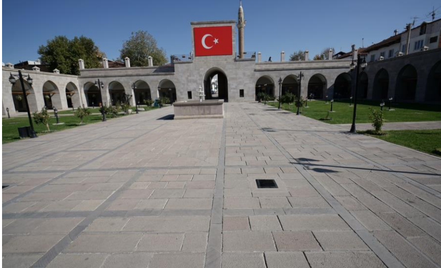
Resim 2. Avlu Doğu Cephesi Görünümü.

turizme artı değer kazandıracaktır. Kervansarayların yiyecek- içecek, konaklama ve eğlence etkinliklerini yürütebilecek düzenlemeler ile turizme kazandırılabilir(Buluç, 1995: 38-42).