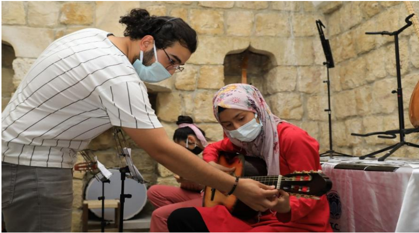
Resim 9. Kervansarayda Kurs Faaliyetlerinden Görünüm.

Battalgazi Belediyesi'nin girişimiyle Silahtar Mustafa Paşa Kervansaray'ında açılan ücretsiz kurslarda; halı, resim, müzik, dokuma, seramik, minyatür, hüsnü hat ve ebru gibi birçok sanatın eğitimi verilerek, halkın katılımına imkân verildi. Düzenlenen kurslar ile istihdama yönelik bu faaliyetler dikkat çekmektedir(Malatya Eksen Haber" Battalgazi Belediyesi'nin Kültür Sanat Kursları Yoğun İlgi Görüyor" 28.07.2021).