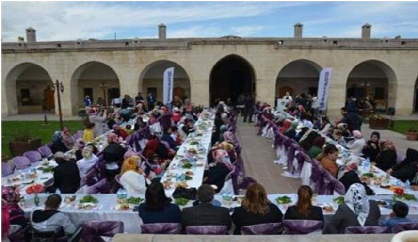
Resim 18. Kervansarayda Anneler Günü Programı.

Battalgazi Belediyesi tarafından 2015 yılında Anneler Günü dolayısıyla Silahtar Mustafa Paşa Kervansarayı'nda program tertiplendi. Konuşmalar ve hediye dağıtımında etkinlik, yoğun ilgi Gördü (Milliyet Battalgazi Belediyesi, "Anneler Günü Etkinliği Düzenledi."10.05.2015).