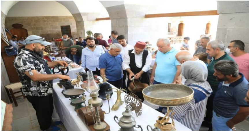
Resim 6. Kervansarayda Antika Pazarından Görünüm.

amacıyla gelecek kuşaklara aktarılmasını sağlamak, Kamu kuruluşları ve sivil toplum örgütlerini tarihi ve kültürel mirasımızın korunması konusunda bilinçlenmesini sağlamaktır. Kervansarayda ilgili öğretmenler aracılığıyla; müzik, resim, ebru, seramik, ahşap oymacılık, tezhip kursu, takı ve tasarım, cam işçiliği, geleneksel el sanatları gibi kurslar verilmektedir. Kurslar ile farklı alanlara yetenekleri olanların kendilerini yetiştirebilecekleri ve geliştirecekleri bir imkân olmaktadır. Şehrin, çekim merkezi yönünü açığa çıkartmak, unutulmakta olan sanatlarımızı tekrar canlandırmak gayesi ile de geçmişî yaşatma planlanmaktadır(Battalgazi Belediyesi, 22.09.2020).