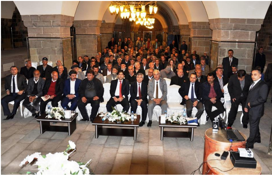
Resim 20. Resmi Kurum Toplantısından Görünüm.

Battalgazi İlçe Gıda Tarım ve Hayvancılık Müdürlüğü tarafından organize edilen, Kırsal Kalkınma Programı tanıtım toplantısı büyük bir katılımı, tarihi Battalgazi Silahtar Mustafa Paşa Kervansarayı'nda düzenlendi(Malatya İl Tarım Orman Müdürlüğü” Battalgazi’de TKDK Programları Anlatıldı” 28.03.2016).