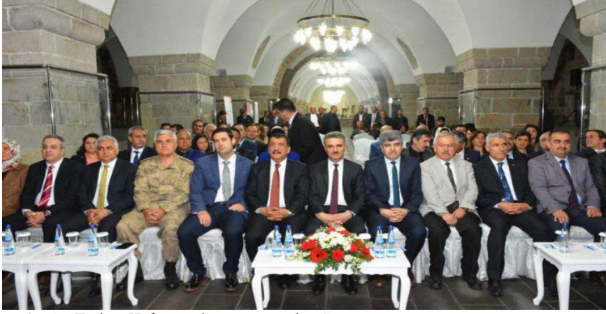
Resim 19. Turizm Haftası açılış programından Görünüm.

Battalgazi İlçe Gıda Tarım ve Hayvancılık Müdürlüğü tarafından organize edilen, Kırsal Kalkınma Programı tanıtım toplantısı büyük bir katılımı, tarihi Battalgazi Silahtar Mustafa Paşa Kervansarayı'nda düzenlendi(Malatya İl Tarım Orman Müdürlüğü” Battalgazi’de TKDK Programları Anlatıldı” 28.03.2016).