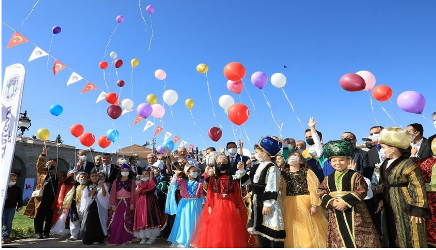
Resim 8. Kervansarayda Bilim Şenliği Etkinliğinden Görünüm.