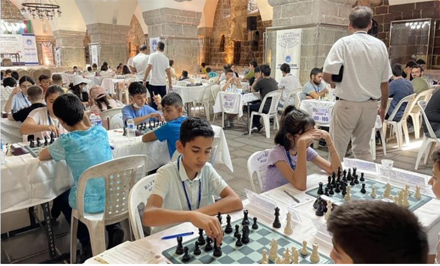
Resim 14. 1. Uluslararası Arslantepe Satranç Turnuvası'ndan Görünüm.

Malatya'da 1. Uluslararası Arslantepe Satranç Turnuvası 16 - 21 Temmuz tarihleri arasında düzenlendi. Silahtar Mustafa Paşa Kervansarayı'nda yapılan turnuva, Battalgazi Belediyesince Gençlik ve Spor Bakanlığı ile Türkiye Satranç Federasyonunun desteği ile gerçekleştirildi. Ülke genelinde kırk yedi vilayetten 420 ve yurt dışında dokuz ülkeden 80 sporcu olmak üzere toplam 500 sporcunun katılımı sağlandı. Battalgazi ilçesinin tanıtımı açısından bu tür organizasyonlar önem arz etmektedir(Anadolu Ajansı "Malatya'da 1. Uluslararası Arslantepe Satranç Turnuvası düzenlendi" 16.07.2022).