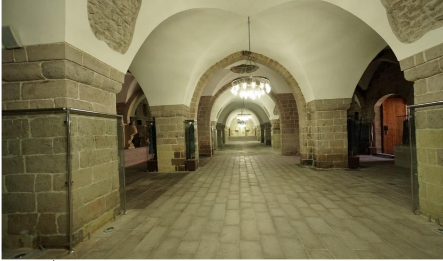
Resim 4. İç Han Orta Neften Görünüm.

Avludan iç hana giriş doğu yönündeki kapı ile sağlanır. Girişle birlikte karşıda Geç Hitit Malatya Beyliği Kralı Tarhunza ve aslan heykeli kopyası bulunur. İç han üç nef halindedir. İç hanın giriş kapısıyla birlikte güney cephesi toplantı ve nikâh töreni amacıyla dizayn edilmiştir. Hanın sütunlarının dikey kenarlarında camekân içerisinde Osmanlı dönemine ait kıyafet ve ayakkabılar sergilenmektedir.