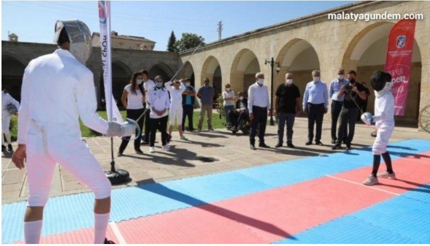
Resim 16. Kervansarayda Avrupa Spor Haftası Etkinliğini Eskrim Müsabakasından Görünüm.