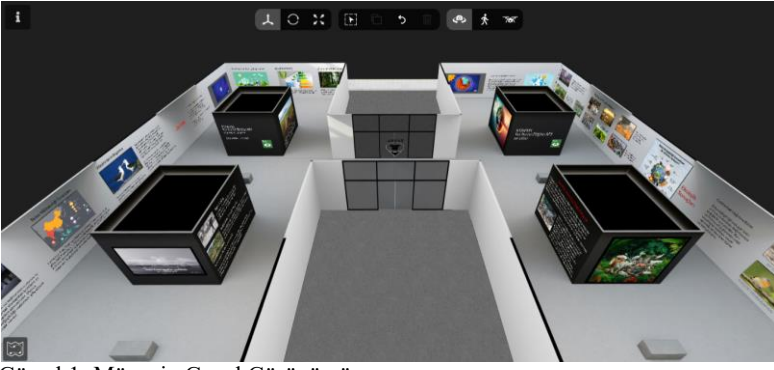
Görsel 1: Müzenin Genel Görünümü