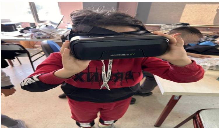
Görsel 6: Uygulama aşaması