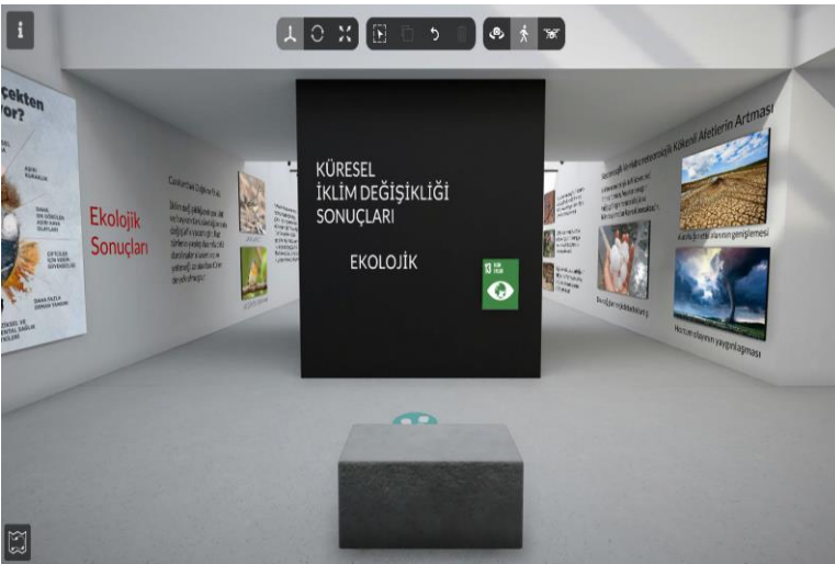
Görsel 3: Müzenin İkinci Bölümü