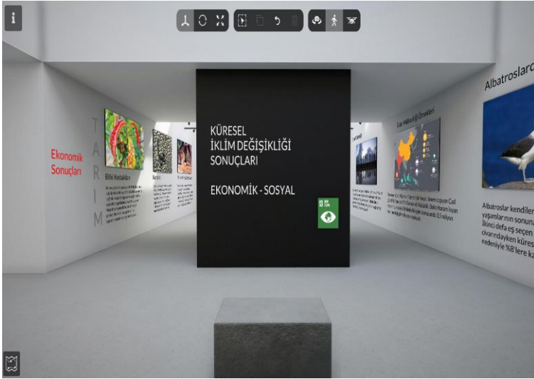
Görsel 4: Müzenin Üçüncü Bölümü