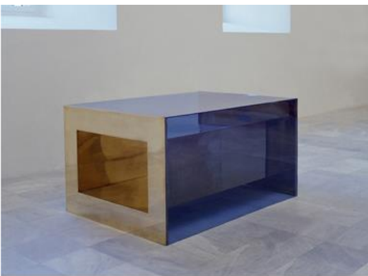
Görsel 2: Donald Judd,İsimsiz, 1973, Pirinç ve mavi Pleksiglas, 83.8 x 172.7 x 121.9 cm

Judd’ın resim ve heykel kavramlarının aksine ‘‘spesifik nesne’’ ya da ‘‘üç boyutlu çalışmalar’’ olarak isimlendirdiği çalışmaları, gerçek bir mekânda yere ya da duvara yerleştirilen, mekânı dolduran, ve mekânla açık bir ilişki kurma özelliğine sahiptir. ‘‘Üç boyutlu çalışmalar’’ heykelin tersine karşılaştırılacak, çözümlenecek ve üzerinde düşünülecek karmaşık parçalara gereksinim duymadan bir bütün olarak görülebilir. Birbirinden ayrılmaz bir bütünü renk, imge, biçim ve yüzeyle bütünleştirmek, geçiş alanlarını, bağlantıları ve orta parçaları yok eder’’(Atakan,1998,20).