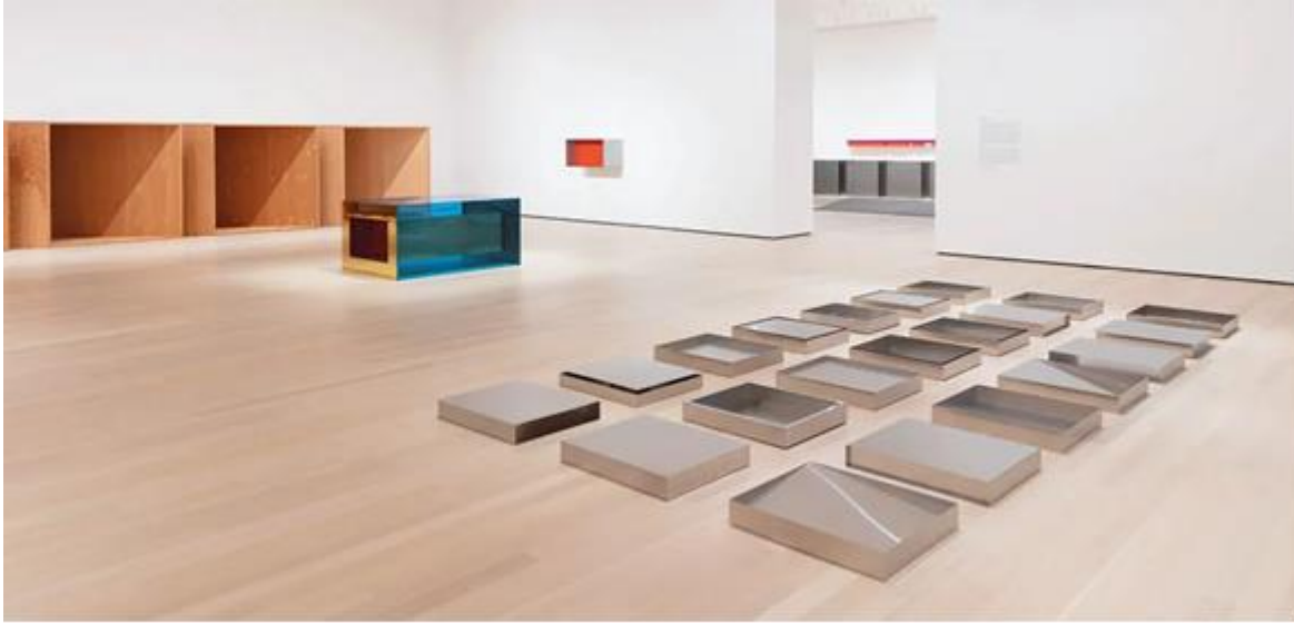
Görsel 5: Donald Judd, İsimsiz, 1976, Paslanmaz çelik 21 bireysel ve benzersiz çalışma, 10.2 × 68.6 × 61cm

bu eleştiri Judd ve diğer minimalistlerin çalışmalarında bir anlam katmanı olarak karşımıza çıkmaz. Bu tekrarlar ısrarlı bir biçimde formun dışında özel olarak görülebilecek herhangi bir anlamın yokluğuna işaret ederler. Her bir form deyim yerindeyse bir kopyadan ibarettir ve diğerinden ayrılmaz. Yapıların tek seferde ve bir bütün olarak algılanması istenmektedir. Hangi açıdan bakılırsa bakılsın görülecek şey saf, basit, pürüzsüz ve soğuk nesnelere.