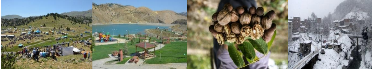
Fotoğraf:1 Yayla şenlikleri, Rekreasyon alanları, AB tescilli coğrafi işaretli Çağlayancerit cevizi, Kar manzaraları.

Yörenin coğrafi yapısı yaylacılık faaliyetlerine uygundur. Bu alanlar hayvancılık faaliyetlerinin yapıldığı kırsal mekânları oluşturmuştur. Manzarası, sessiz, sakin ve huzurlu bir atmosferi, doğal peyzajı, havası, flora ve faunası ile yörenin gözde mekânlarını oluşturmaktadır. İlçe'nin kuzey'i Engizek, güney'i Öksüz dağı, doğusu Erinci, batısı Kazıklı ve Topal Ali dağları ile çevrilidir. Engizek Dağı'nın kuzeyinde Ali Bey Uşağı yaylası; Engizek Dağı'nın zirvesinde Büyük yayla; Ayrınpınar, Zeynep Uşağı, Âbuhayat yaylası, Maksut Uşağı, Alikler, Mehmedo ve Soğuk Pınar yaylaları vardır. Yörede Doğu Akdeniz Kalkınma Ajansı tarafından kırsal turizme ivme kazandırıp doğa ve sporseverlerin merkezi olabilecek Daz Seyir Terası Projesi yapılmıştır. Zorkun Deresi'nin iki yamacını asma köprüyle birbirine bağlayan ellibeş bin metre karelik alanda Trekking ve bisiklet yolları, ATV taşıt yolu, Bungalov evleri, Zorkun Göleti ve Göl Cafe bulunmaktadır. Proje dâhilinde Helete mahallesinden, Yeşil ve Ayrınpınar yaylalarına, oradan Alikocalar ve merkez ilçeye kadar 70 km'lik parkur bulunmaktadır. Yörede ağaçlandırma çalışmaları da yapılmıştır (URL:4).