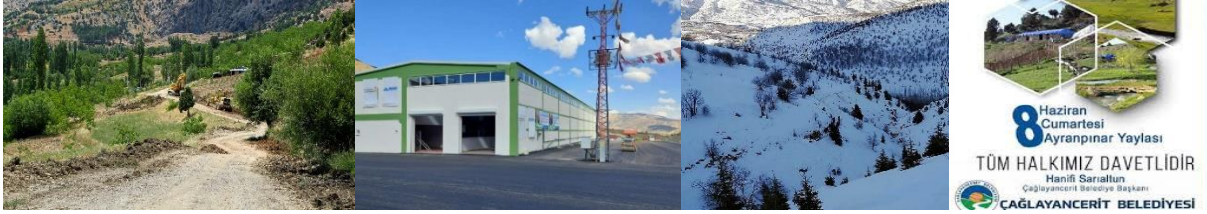
Fotoğraf:2 Dağlık alanlardan kış ve bahar görüntüleri, Ceviz işleme tesisi, Belediye festival afişi