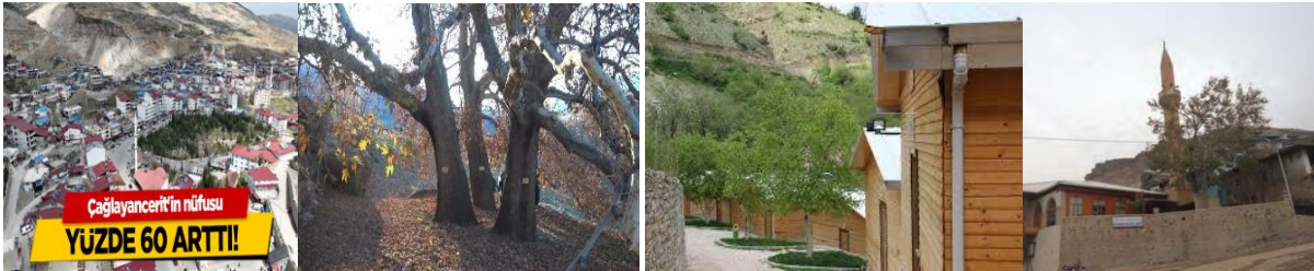
Fotoğraf:3 Çağlayancerit merkez (6şubat 2023 Kahramanmaraş merkezli depremler sonrası), Anıt ağaçlar Kızfatma çınarları, Bungalov evler, Keziban Sultan camisi

Yörede geleneksel halk oyunları ve halk giysileri gibi kültürel unsurlar da önem taşımaktadır. Annelerin, genç kızların dokudukları halılar, çullar, zahire koymaya yarayan çuvallar, giyilen abalar ve kebeler, şalvarlar, rengârenk nakışlı azık torbaları, heybeler ve bunların üzerine işlenen ve birçok farklı isimlerle anılan nakışlar maddi kültür varlıkları arasındadır. Düğünlerde ise davul, zurna ile halaylar çekilir, oyunlar oynanır (URL:6).