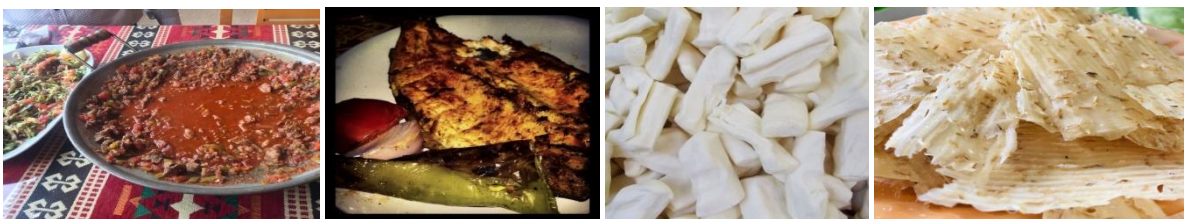
Fotoğraf:4 Maraş tava, Alabalık, Helete keçi peyniri ve Maraş tarhanası

Yörede yerel kurum ve kuruluşların katkıları ile her yıl Çağlayancerit cevzinin tanıtımı ve pazarlamasının sağlanması için Eylül ayında Ceviz ve Kültür Festivali düzenlenmektedir. Festivalde çeşitli etkinliklere yer verilmektedir. Haziran ayında Ayran pınarı yayla festivali ve Helete yayla şenlikleri yapılmaktadır. Bu etkinliklerde yöre insanı kamp kurup, ateş yakıp, mini yarışmalarla davul zurna eşliğinde çeşitli oyunlar oynar (Fotoğraf:1-2) (URL:7). İlçede Kültür ve Turizm Bakanlığı'ndan onaylı bir tesiste oda sayısı on yatak sayısı ise yirmidir (Kültür ve Turizm İl Müdürlüğü, 2017). Tarım ve Kırsal Kalkınmayı Destekleme Kurumu'nun hibe desteği ile özel girişim tarafından Çağlayancerit Köy Evleri Kırsal Turizm Projesi yapılmıştır. 12 ay hizmet veren yüzme havuzu, 1 milyon 266 bin 496 lira yatırımlı, Ertunç Çiftlik-Köy Evi 40 kişiliktir. 15 adet 1+1 Bungalov evi, 300 kişilik açık ve 90 kişilik kapalı alana sahip yöresel mutfağı, lokantası, çocuk oyun parkı, saunası ve Türk hamamı vardır (Fotoğraf:3) (URL:8).