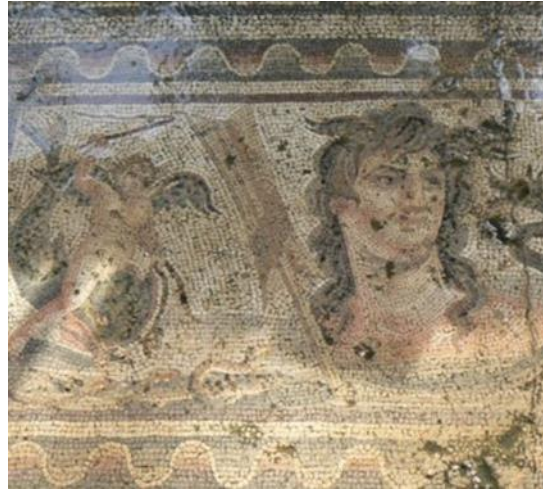
Fig. 3. Tehys ve Cupido(n)