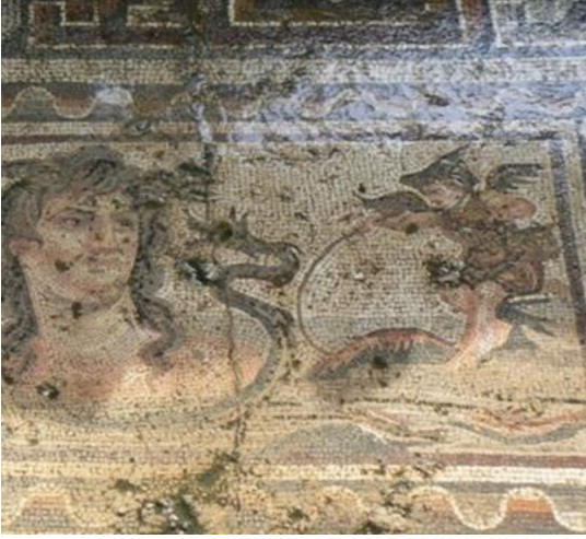
Fig. 2. Tethys ve Giyimli Cupido(n)