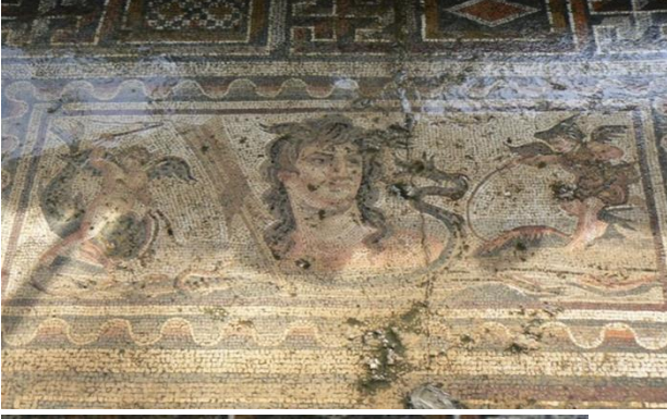
Fig. 1. Anazarbos Tethys'li Mozaik. (2014 yılında fotoğraflanmıştır).