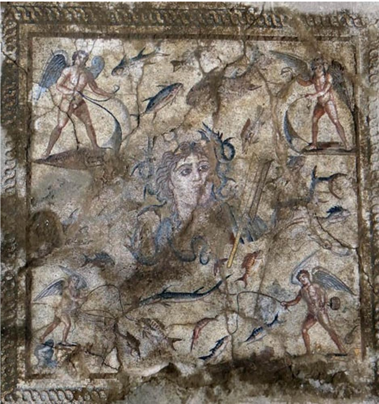
Fig. 7. Yumurtalık'ta Bulunan Tethys'li Mozaik