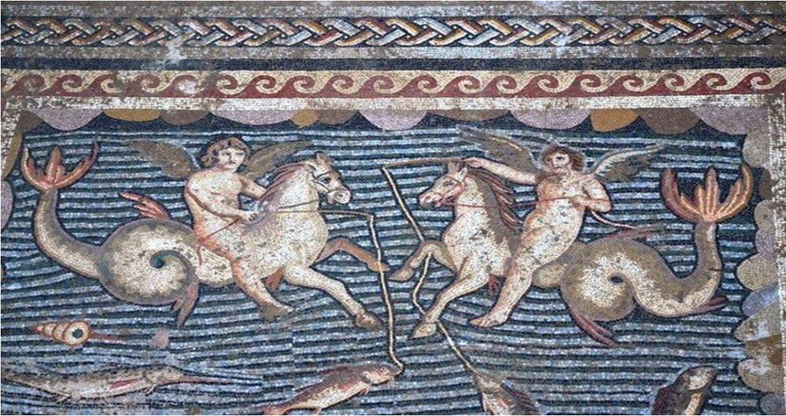
Fig. 4. Yumurtalık'ta Bulunan Hippokampos'lu Mozaik