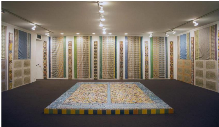
Resim 3: Joyce Kozloff, 1979, Tibor de Nagy Galerisi'nden Bir İç Dekor / An Interior Decorated, Tibor de Nagy Gallery,

"Kültür sanat ilişkileri, toplumların düzenli yaşamak için kullandıkları kimi zaman etnik coğrafya kaynaklı, kimi zamanda baskın kültürlerin kültürleşme potansiyeline bağlı olarak gelişmektedir" (Şentürk, 2015: 200).