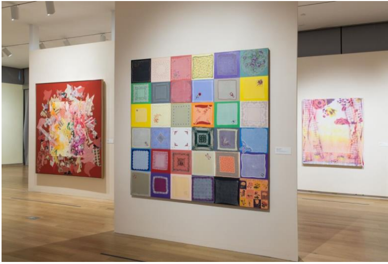
Resim 2: Installation view of "Surface/Depth: The Decorative after Miriam Schapiro." 1976 183x183

Sanatta optik-fiziksel yaklaşımın iflas etmesinden bahseden Paul Klee gibi sanatçılar, ( soyut ifade ve bakış açısının söylemini Batı diliyle tekrar yorumlama çabası içine girmişlerdir. Bu anlamda başka kültürlerin motiflerindeki anlatımı sanat mecrasına dâhil ederek geleneğin okunmasını sağlamışlardır. (Resim 1) 1928 yılında Tunus ve Mısır'ı ziyaretinde etkilendiği imgeleri çalışmalarına yansıtarak, doğunun imgesel kültürünü kendi anlatım diline yansıtan Paul Kleeden şimdide güncel sanat pratiklerine konu olarak kültürel motiflerin yorumu ve gelenekselin aktarımında yol gösterici olarak bahsedilebilir (Yücel, 2021: 30).