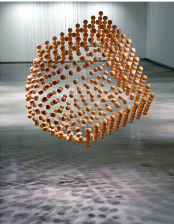
Resim 7: Canan Dağdelen, Canevine dot Porcelain, fine steel cord 150 x 130 x 150 cm, 2007

Sanatçı yerleştirmesinde (Resim 6) 19. Yüzyıl batı ve İslam dünyası bitki ve hayvan motiflerini anımsatan metaforları ile güncelde toplumsal, politik ve sosyo-kültürel koşullar içerisinde kadın, toplumsal cinsiyet vef kimlik politikalarına kendine özgü bir ifade alanı oluşturmaktadır ( https://archives.saltresearch.org/handle/123456789/205121 ).