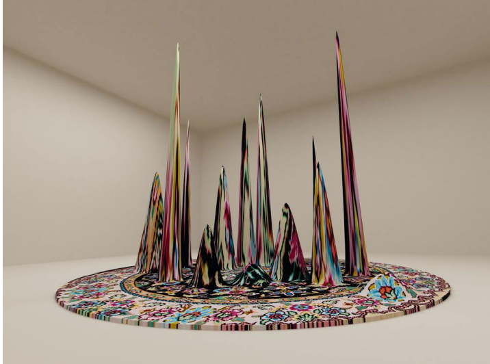
Resim 4: Faik Ahmed “Sculptures // “Carpet Equalizer,” 201

“1970’li yıllarda kadınlara özgü sanatın temellerini araştıran Joyce Kozloff, kadın üretimiyle özdeşleştirilen el sanatı, zanaat, dekorasyon gibi olgulardan yola çıkarak daha ‘minör’ görülen bu üretimleri güzel sanatlar mertebesine yükseltmenin çeşitli yollarını denedi. Kadınların ürettiği el sanatları ürünlerinde yüzyıllarca kullanılan motiflerin izini sürerek bunları çağdaş sanata uyarlayan Kozloff, dönemin önde gelen akımlarından minimalizm ve kavramsal sanata karşıt bir tavır içinde, sanat ortamının 'dekoratife yönelik kaygısının üzerine gitti” ( Antmen, 2012: 29).