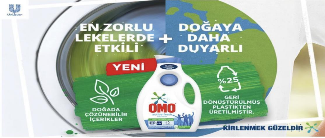
Görsel 4: Omo reklamı