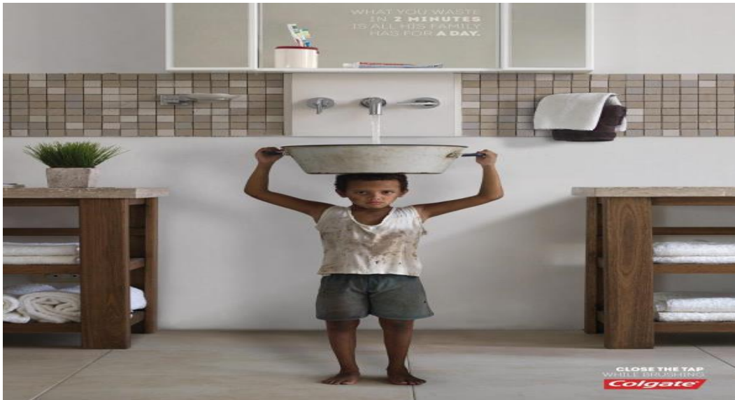
Görsel 3: Colgate reklamı

Bulaşık makinesi deterjan üreticilerinin son zamanlarda artan bir oranda bu mesajları vermeleri tesadüf eseri değildir. Artan nüfus ile beraber, her hane bulaşıklarını elde yıkayarak, günlük su tüketiminin büyük bir bölümünü bu alanda harcamaktadırlar. İşletmelerin kullandıkları ifadeler kaygının artık temizlik değil, su kıtlığı olması gerektiği yargısını taşımaktadır.