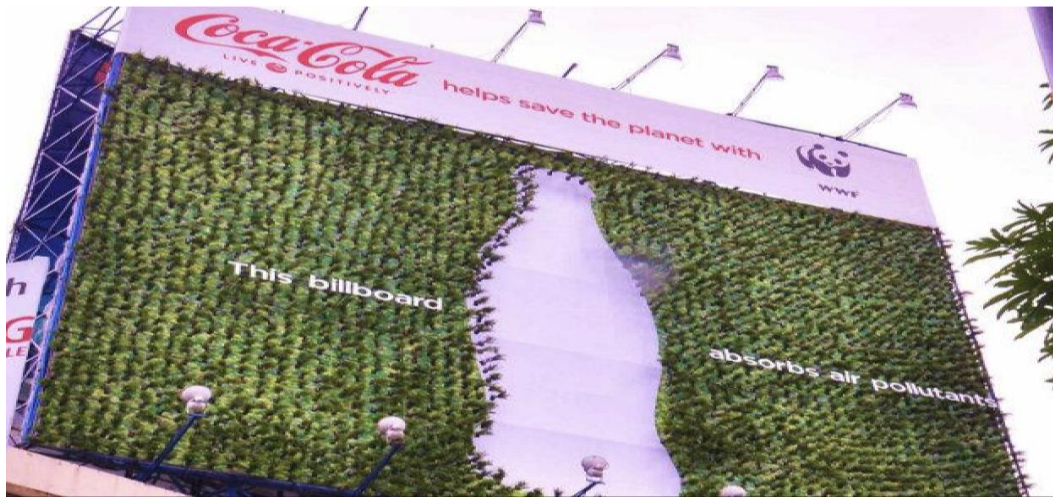
Görsel 5: Coca-Cola reklamı

Çamaşırın elde yıkanması eskisi kadar yaygın olmamakla beraber, kullanılan deterjanların insan ve doğaya karşı zararlı olduğu ifade edilmektedir. Bu ürünlerin daha doğal içerikler ile üretilmesi doğaya karşı iyi niyetin en büyük adımı olacaktır. Ayrıca birçok sektör üretiminde bir girdi olarak su kullanılmaktadır. Kullanılan su kaynaklarının kirlenmemesi, ayrıca atıkların da aynı kaynağa bırakılmaması kritik öneme sahiptir.