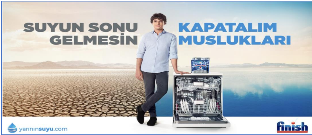
Görsel 2: Finish reklamı

Kaynak: https://www.pazarlamasyon.com/finish-yarinin-suyu-hareketi-icin-turkiyede-ilk-kez-iki-diziyi-bir-araya-getirdi (Erişim Tarihi: 25.05.2022).