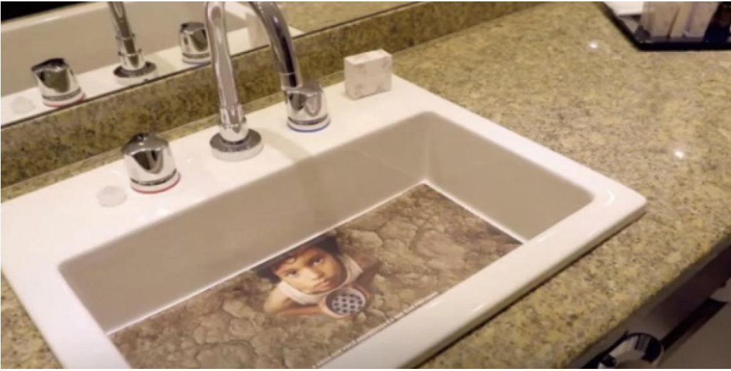
Görsel 6: Colgate reklamı