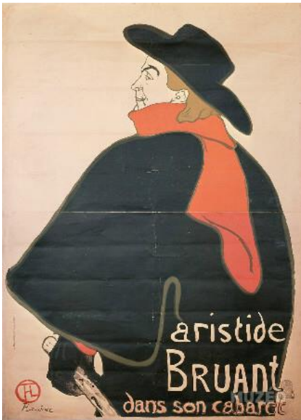
URL- 8: Aristide Bruant Dans Son Cabaret, 1893

Lautrec'in 1893 yılında yaptığı "Le Divan Japonais" afişi URL- 7'de görülmektedir. Lautrec, gölgesiz bir yaklaşımla siyahın yoğunluğuna dikkat çekmektedir. Afişte, ayrıntılı olarak iki figür tasvir edilmiştir. Afiş tasarımındaki karakter tasvirleri, eğlenceye gelmiş temalarını vurgulamaktadır. Oturan bayan figürü afişin tam ortasında yer almaktadır. Bazı figürler stilize tonda çizilirken, dış kısımlar kontörlerle belirginleştirilmiştir. Figürlerin vücut bölümleri ana hatlarıyla çizilmiştir. Arka plandaki gri tonlarda oluşturulan belirli belirsiz figürler sayesinde perspektif oluşturmuştur. Afişte metin, resim öğeleriyle birlikte kullanılmıştır. Yazı karakteri özgün yazı tekniği figürlerde olduğu gibi kontörlü olarak kullanılmıştır. Bu kullanım şekli ile afişte tipografi ve görseller birbiriyle uyumlu hale getirilmiştir.