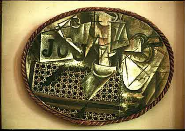
Görsel 2: Pablo Picasso, Bambu Sandalyeli Natürmört, ,1912, Tuval Üzerine Yağlıboya ve Muşamba, Oval, 30 x 38cm.

Georges Braque'ın "Meyve Tabakası ve Bardak" adlı resmi "Sentetik Kübizm" in ilk çalışmalarından biridir (Görsel 3). Resim karakalem tekniği ile yapılmış ön planda ise ahşap izlenimi verecek bir duvar kâğıdı ile kaplanmıştır. Bu iki resimde de nesnenin çizilmesi yerine kendisinin tuval yüzeyi üzerine monte edilmesi, aynı resimde farklı bir resimsel dilin kullanılması, kolaj adı verilen yapılandırma tekniğinin uygulanması resim sanatında o güne kadar görülmemiş geleneksel yapının son bulduğunun göstergesi olmuştur. "Bu sanatçıların Kübizm dönemlerinde yaptıkları resimlerse, öylesine birbirine benzer ki bunları ayırmak bile kolay olmaz. Karşılıklı etkiyle açıklanamayacak olan bir benzerlik, Kübizm'in 20.yüzyılın başında bir çağ üslubu olarak ortaya çıktığını kanıtlıyor. Endüstri çağına özgü olduğunu söylediğimiz oluşturuculuk Kübizm 'in biçim-diliyle konuşmaya başlıyor ve sanat tarihinde yeni bir çıkış açılıyor" (İpşiroğlu, 2017: 47). Bu dönemde, endüstrideki gelişmeler sanatıda etkilemiştir.