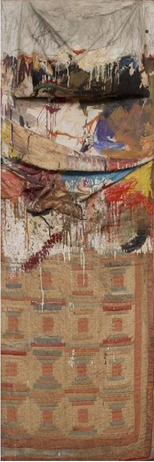
Görsel 4: Robert Rauschenberg, Yatak, 1955, Ahşap Destek Üzerine Yastık, Yorgan, Çarşaf, Yağlı Boya ve Kalem, 191.1x 80 x 20.3 cm.

Richard Hamilton'un 1956 yılında yaptığı "Günümüzün evlerini bu denli farklı, çekici yapan nedir?" adlı kolaj çalışması, batı dünyasında o dönemde herkesin istediği bir yaşamı resimlemiştir (Görsel 5). Hamilton bu çalışmasında, televizyon, ev de kullanılan gereçler, kaslı bir erkek manken ile koltukta bulunan çıplak kadın manken, duvarda asılı bir portre ile Young Romance'nin kapağı kâğıt üzerine monte etmiştir. Sanatçı bu eserinde her yerde bulunabilecek nesnelere yararlanarak sanat yapması, geleneklere karşı bir başkaldırı olarak değerlendirilebilir (Lynton, 1982: 2953). Sanat eserinin kolaj çalışması ile oluşumu bu dönemden sonra daha da hızlanmıştır.