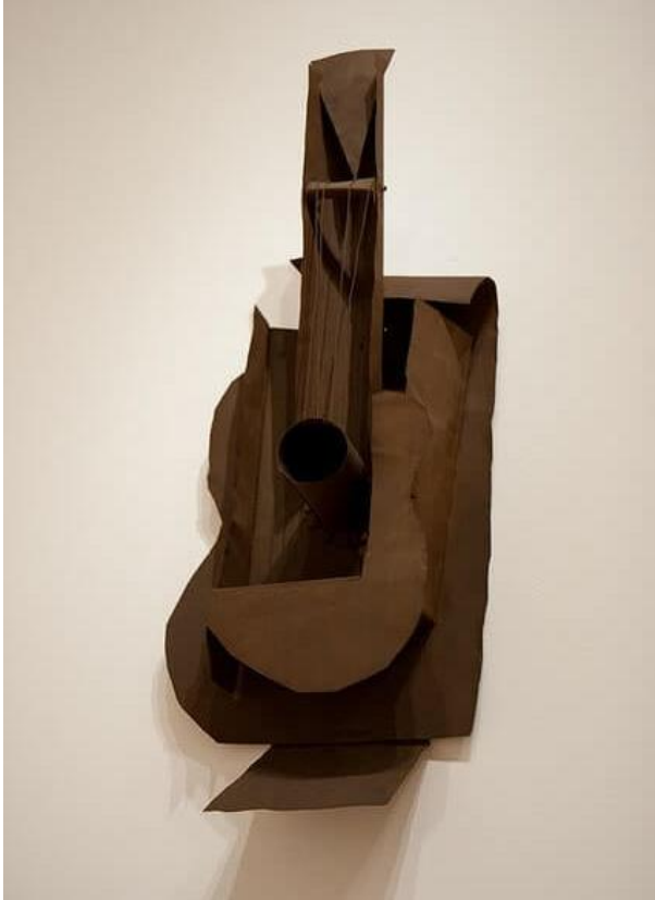
Görsel 6: Pablo Picasso, Gitar, 1912, Tabaka Halinde Metal ve Tel.77x33x19cm.

Kolaj tekniđi, kullanılan malzemeye göre farklılıklar göstermektedir. Bunlardan ilki Kâğıt Kolajdır. Kâğıt kolaj, tuval yüzeyi üzerine kâğıt kullanılarak deđişik etkiler ve formlar oluşturmak için yapılan bir tekniktir. Bu tekniđi Picasso, Braque ve Juan Gris ilk kolaj çalışmalarında kullanmıştır. Kesik Kolaj tekniđi, renkli kağıtlardan kesilen parçaların katmanlama yoluyla düzenlenmesi ve yapıştırılması ile oluşturulan çalışmadır. Henri Matisse son dönem çalışmalarını bu teknikle yapmıştır. Foto Kolaj, görüntüyü farklı bir boyuta sokmak için başka fotoğraflardan alınan parçaların fotoğraf üzerine yapıştırılması ile gerçekleştirilen bir tekniktir (Erturk,2023:1). Asamblaj, endüstriyel parçaları yeni bir düzen oluşturmak için birleştirilerek yeni bir form oluşturma çalışmasıdır. Bu çalışmayı ilk uygulayan sanatçı Picasso olmuştur. Picasso'nun "Gitar" isimli çalışması bu tekniđe örnek olarak verilebilir (Kılınç, 2019:13) (Görsel 6).