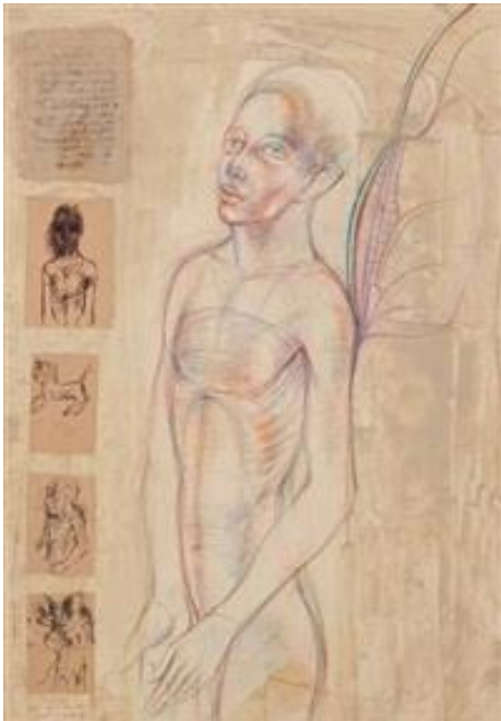
Görsel 9: Ergin İnan, Berlin Meleği, 2005, MDF üzerine karışık teknik, 100x70cm.

Ergin İnan, “Havva” adlı bu resminde, kâğıt üzerine oluşturduğu eski yazıtları kolaj tekniği ile bir araya getirmiştir (Görsel 8). Resmin ortasına yine bir portre yerleştirmiştir. Teknik ve malzemede değişik malzemeler kullanan sanatçı düş ile gerçeği sorgulamaktadır. Resmin farklı yerlerine çizdiği desenler ve uyguladığı değişik boyama tekniklerinin bir araya gelmesi eski ile yeninin bir sentezi olarak değerlendirilebilir. Birçok resminde olduğu gibi, Rönesans dönemine özgü anatomik araştırmalar yaptığı resminde, batı tarzı eğitim almanın verdiği bir özellik olarak görülebilir. Portrede kullanılan renk çeşitliliği ve uyumu, çizgi ile buluşarak bir bütünlük sağlamıştır.