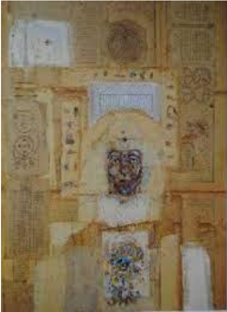
Görsel 8: Ergin İnan, “Havva” Kâğıt Üzerine Kolaj ve Desen, 110 X77 cm

yapıştırılmıştır. Portrenin altında, sanatçının karşılıklı iki figüründen oluşan eskizi bulunmaktadır. Portrenin sağında ve solunda görülen fantastik çizimler, yine ahşap yüzey üzerine kolaj tekniği ile bir araya getirilmiştir. Resimde, portre, figür ve böcekler özgün bir anlatımla bir araya getirilmiştir. Ergin İnan, resimlerinde kullandığı harfler ve böcekler hakkında şunları söylemiştir.” O sözcükler ve harfler başka bir şeyi anlatıyor, her ressamın kendine özgü bir dili vardır. Harfler bazen ya böcek oluyor ya da orada bazen eski yazıdaki harf dizisi oluyor. Ama bazen de çok önem verdiğim bir yazarın düşünceleri oluyor. Ama her şeyden evvel ortaya koyduğumuz dil kendi dilimiz oluyor. Bir kere böcekler ne söyler ben bilmiyorum ama yazıları resim olarak ortaya koyduğumuzda onlar yan yana geldiği için birlikte bir şeyler söylüyorlar. Yeni bir dil oluşuyor resmin içerisinde, bir heyecan oluyor. Başka bir şey görmeye başlıyorsunuz. Harfler de öyle, resme benzeyen o eski yazılar bana öyle geliyor. Yazılmış eski kağıtlar, bir kısmı yan yazılmış bir kısmı istifler yapılmış kağıtlarda...İşte orada onlara baktığımda öyle bütünlenmiş resimler görüyorum. Eskimişlikleri de bana bir resim tadı veriyor çünkü bir “zaman” resmin içerisine girmiş gibi geliyor bana. Resmi var etmenin içerisine muhakkak zamanı da koymak gerek. Geçen bir an var ve oranın geçtiği yer var” (Eyigün, 2008: 21).