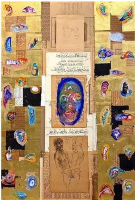
Görsel 7: Ergin İnan, Brief, 2003, Ahşap Üzerine Yağlıboya, Kolaj, 100x70 cm.

Ergin İnan resimlerinde, sahaflardan topladığı eski kitap sayfalarını resmin fonu olarak kullanmıştır. Kendi çizdiği desenleri, ince kâğıt kolajlara yerleştirmek sureti ile tuvalin yüzeyine uygulamıştır. Eski kitap sayfalarını birbiri ile birleştirmek sureti ile kolaj tekniğini meydana getirmiştir. Sanatçı, bu parçaları kolaj izlenimi oluşturmayacak şekilde, tuval yüzeyi üzerine gizlemiştir. Böylece, aslında parçalardan oluşan fonu bütün olarak göstermiştir.