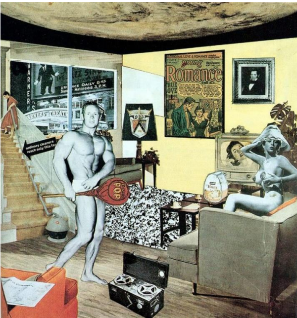
Görsel 5: Richard Hamilton, Günümüzün Evlerini Bu Denli Farklı, Çekici Yapan Nedir?1956, Kâğıt Üzerine Kolaj.