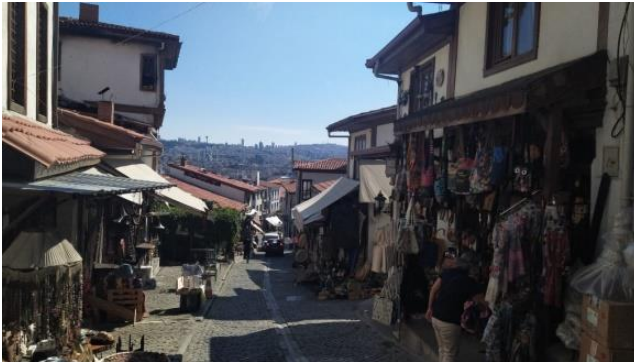
Şekil 4. Kale'ye çıkan Koyunpazarı Sokak ve Ticarethaneler

Ankara, Roma döneminden başkent seçilene kadar olan süreçte birçok medeniyete yurt olmuştur. Önemli yollar üzerinde yer aldığından ticaret yoluyla kültürel etkileşim fazla olmuştur. Kent 1916 yılındaki yangında birçok önemli eserini kaybetmiştir. Ankara 1923 yılında kentin başkent olmasıyla idari sorumluluğu üzerine almış, kültürel, idari, ekonomik etkinlikleri de böylelikle koordine eder olmuştur. Osmanlı himayesindeki dönemde yaklaşık olarak 30.000 nüfusa sahip kale çevresindeki yerleşimden ibaret olduğu bilinmektedir. Milli mücadele döneminde Ankara mücadelenin başlama ve yönetim merkezi olmuştur. 1924 yılında şehrin başkent oluşu nüfusta hareketliliğe neden olarak büyük bir kent olma yolunda adımlar atmaya başlamıştır (Demiröz ve ark; 2018).