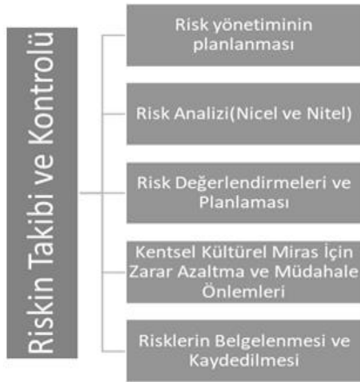
Şekil 1. Risk Takibi Şeması

Risk yönetiminde hedef; riskin gerçekleşme olasılığı ve riskin yaşandığı zaman etkilerini azaltmaktır. Risk yönetim planının işlevsel olması için tasarımı döngü boyunca etkin bir şekilde uygulanmasına bağlıdır. Bu bağlamda risk yönetim süreci önemli 4 ana maddeden oluşur: risk tanımı, risk analizi, riske verilen cevapların geliştirilmesi ve kontrolüdür (Şekil 1). Bu kapsamda öngörülen ve planlanan tedbirler ile beklenmeyen, belirsiz olan risklere karşı üretilmesi gereken acil durum planları riskin kontrolü yönü ile önemlidir (Kuzucuoğlu, 2014) (Satır ve Topraklı, 2021). Çalışma kapsamında, Ankara'nın 8. yüzyıla dayanan köklü tarihi incelenmiş, 1924'te başkent olduktan sonraki şehir ve planlamaları genel olarak değerlendirilmiştir. Yapılan bu planların kalenin değişimine olan olumsuz etkilerine yönelik tespitler yapılmıştır.