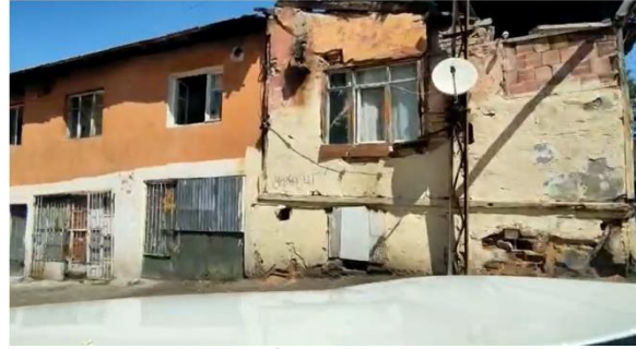
Şekil 15. Altındağ İlçesi mülteci ailelerin yaşadığı mahalle örnekleri