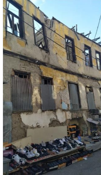
Şekil 12. Hacıbayram ve Ulucanlar arasında kalan bir sokak

Kültürel miras risk yönetiminde doğa afetler, yapısal sağlamlaştırılmalar, müdahaleler ve devamında nitelikli bir kullanım olanaklarının sunulması sürecin sürdürülebilir olmasının en önemli bileşenidir. Bu bağlamda kale için yeniden işlevlendirmelerine bakıldığında ticari aktivitelerin çok yoğun olduğu gözlemlenmiştir. Bu ticari mekanların da tarihi yapı ve çevreleyen nitelikli kullanımları sağlanmalı, yapıların özgün kimliklerini değiştirecek müdahalelerin önüne geçilmelidir. Kentsel çevrenin gün boyu sağlıklı yaşayabilmesi için gece ve gündüz nüfusun dengeli dağıtımı, ticaret fonksiyonları kadar konut fonksiyonlarının da kentte yer alması gerektiği söylenebilir. Bölgede ticaret ne kadar çok teşvik edilirse kentte spekülasyon bir rant artışını beraberinde getirmekte, kültürel miras tüketim nesnesi olarak görülebilmektedir. Böylelikle mirasın ekonomik değeri ön plana çıkarak, kültürel değeri göz ardı edilebilmektedir. Ticaretin ağırlık olduğu bölgelerde gündüz nüfusun çekilmesi ile kuytu, güvenlik problemleri olan yerleşimlerin oluşması doğaldır. Gece kullanılan mekanların ise standartları denetlenmesi, yeni işlevin ayrı bir güvenlik sorunu oluşturacak şekilde kullanılmasını önüne geçilmelidir. Kentsel çevrenin ve mekanların kalitesi kullanıcı niteliğini de doğrudan etkilemektedir. Kale civarında nitelikli mekanlar arttıkça, ticaret nitelikli oldukça ziyaret edenlerin eğitim durumu, gelir seviyesinin daha artmış kullanıcı profiline değişeceği söylenebilir (Urak, 2002).