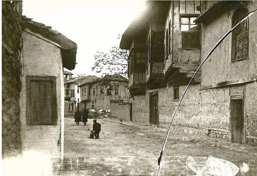
Şekil.10. Eski Hamamönü evlerinden bir fotoğraf (URL 1)

Bölgede çok sayıda terk edilmiş sivil mimarlık örneği gözlemlenir. Genelde Osmanlı döneminden evler yer almaktadır. Bu evler geleneksel mimarimizin özel örneklerini oluşturur. Bu evlerin cumbaları ve kapalı çıkmaları, pencerelerdeki kafes sistemleri dikkat çekicidir. Hamamönü bu yönü ile dikkat çekicidir. Bölgede son yıllarda yapılan kentsel yenileme ve koruma uygulamalarına rağmen çok sayıdaki sivil mimarlık örneğinin bakımsızlık ve kaderine terk edilmesi sebebiyle risk altında olduğunu söylenebilir.