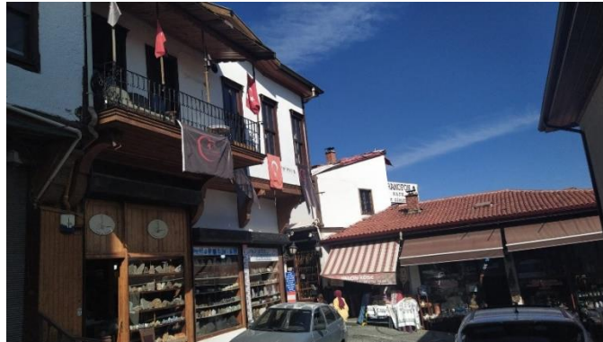
Şekil 13. Doğal taşlar ve tesbih satan bir dükkan ve çevre iş yerleri

Kültürel miras risk yönetiminde doğa afetler, yapısal sağlamlaştırılmalar, müdahaleler ve devamında nitelikli bir kullanım olanaklarının sunulması sürecin sürdürülebilir olmasının en önemli bileşenidir. Bu bağlamda kale için yeniden işlevlendirmelerine bakıldığında ticari aktivitelerin çok yoğun olduğu gözlemlenmiştir. Bu ticari mekanların da tarihi yapı ve çevreleyen nitelikli kullanımları sağlanmalı, yapıların özgün kimliklerini değiştirecek müdahalelerin önüne geçilmelidir. Kentsel çevrenin gün boyu sağlıklı yaşayabilmesi için gece ve gündüz nüfusun dengeli dağıtımı, ticaret fonksiyonları kadar konut fonksiyonlarının da kentte yer alması gerektiği söylenebilir. Bölgede ticaret ne kadar çok teşvik edilirse kentte spekülasyon bir rant artışını beraberinde getirmekte, kültürel miras tüketim nesnesi olarak görülebilmektedir. Böylelikle mirasın ekonomik değeri ön plana çıkarak, kültürel değeri göz ardı edilebilmektedir. Ticaretin ağırlık olduğu bölgelerde gündüz nüfusun çekilmesi ile kuytu, güvenlik problemleri olan yerleşimlerin oluşması doğaldır. Gece kullanılan mekanların ise standartları denetlenmesi, yeni işlevin ayrı bir güvenlik sorunu oluşturacak şekilde kullanılmasını önüne geçilmelidir. Kentsel çevrenin ve mekanların kalitesi kullanıcı niteliğini de doğrudan etkilemektedir. Kale civarında nitelikli mekanlar arttıkça, ticaret nitelikli oldukça ziyaret edenlerin eğitim durumu, gelir seviyesinin daha artmış kullanıcı profiline değişeceği söylenebilir (Urak, 2002).