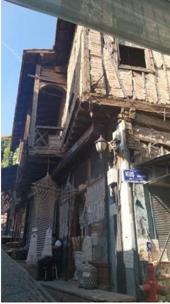
Şekil.11. Hacıbayram ve Ulucanlar arasında kalan bir sokak