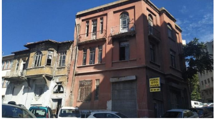
Şekil 9. Cumbalı Osmanlı evlerinin yer aldığı bir sokak (Ulus, Altındağ, Ankara)

Bölgede çok sayıda terk edilmiş sivil mimarlık örneği gözlemlenir. Genelde Osmanlı döneminden evler yer almaktadır. Bu evler geleneksel mimarimizin özel örneklerini oluşturur. Bu evlerin cumbaları ve kapalı çıkmaları, pencerelerdeki kafes sistemleri dikkat çekicidir. Hamamönü bu yönü ile dikkat çekicidir. Bölgede son yıllarda yapılan kentsel yenileme ve koruma uygulamalarına rağmen çok sayıdaki sivil mimarlık örneğinin bakımsızlık ve kaderine terk edilmesi sebebiyle risk altında olduğunu söylenebilir.