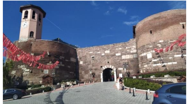
Şekil 5. Hisar kapı.

Ankara şehri bir Roma kentinin niteliklerini taşıdığı gibi şehrin doğusuna doğru idari ve kamusal alanlar Erken Cumhuriyet döneminde eski kent yapısı genişlemeye başlamıştır. Bu dönemde kentte kamu yapıları da mevcuttur. Kentte, 1995 tarihinde yaptırılıp ve açılışı 1920 tarihinde yapılan Büyük Millet Meclisi, Maarif Vekaleti Binası yani eski adıyla Dar-ül Muallimin, Mektebi Sanayi Binası, Tuz Nazırlığı Binası ile bunun