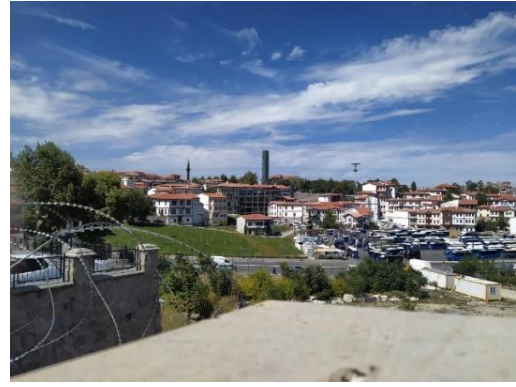
Şekil 7. Otobüs Durakları ve Hıdırlıktepe

Ankara kalesi diğer şehirlerdeki kalelerden farklı olmasında hala devam eden bir yaşamın olmasıdır. Alan incelendiğinde, alanda yoksullaştırma, değersizleştirme, kimlik kaybı, işlev kayıpları ve koruma hataları olduğu görülmüştür. Kale ve çevresindeki evleri orta ve üst gelir grubu olarak yatırım yapmıştır. Amaçları ileriki dönemlerde bölgeye uygulanacak olan kentsel dönüşüm projeleriyle yatırımlarının değer kazanmasıdır. Çevrede yer alan halıcı, antikacı, sanat atölyelerinin hedefinde kale bölgesinde yaşayanlar değil bölge dışındaki kitle olmuştur. Orta sınıfın soylulaştırmada rolü iş yeri satın almak olmuştur. Fakat bölgede konutun yerini iş yerlerinin almaya başlamasıyla değer farkına varan ev sahipleri rant elde etmek için iş yerlerinin satış fiyatlarını yükseltmeye başlamıştır. Bu durum bölgedeki değişimi zorlaştırmıştır. Hizmet ve yatırım anlamında eksiklerin çok olduğu bölgedeki bu düşünce değişim ve kullanım arasındaki farkı açmıştır (Artar, 2015; Artar, 2014).