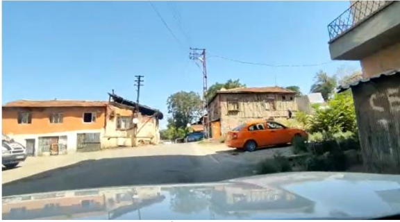
Şekil 14. Altındağ İlçesi mülteci ailelerin yaşadığı mahalle örnekleri

Bu değerlendirmeler kale ve civarında hem ekonomik hem de sosyal olarak önemli farklılıkların olduğunu göstermektedir. Sağlıklı bir kentsel yaşamın oluşturulması için kentin yaşam standartlarının ve kalitenin artırılması, kentli arasında ekonomik bir dengenin kurulması gerekli görülmektedir. Bu dengenin kurulmaması durumunda kentsel ve sosyal yönden riskler oluşmakta mekan kalitesi düşük izole mekanlar oluşmaktadır. Bu mekanların kültürel mirasın yoğun olduğu bölgelerde oluşması kültürel mirasın fiziksel güvenliği için risk oluştururken hem de tüm kentin tarihi kültürü kaybettirecek riskler oluşturmaktadır.