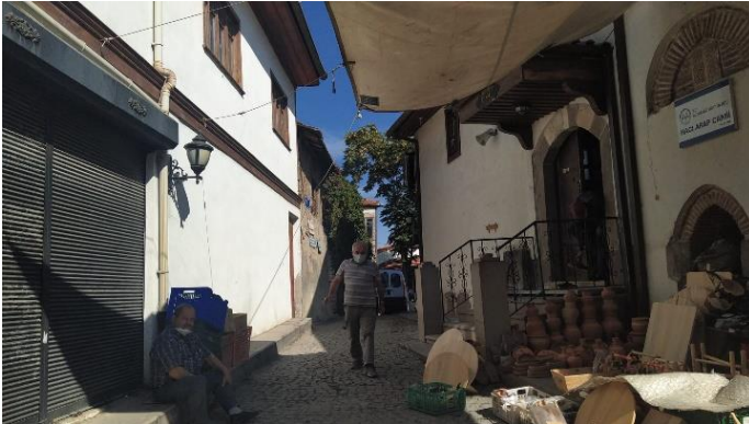
Şekil 6. Hacı Arap Cami

Şu anda Kale, kalabalık ve düzensiz eski şehrin içinde kalmıştır. Küçük atölyelerden ticari alanlara kadar çeşitli işlevleri barındıran merkez, çeşitli tiplerde birimler, büyük bir tren istasyonu, hastaneler, müzeler, alt seviye oteller ve konut yer almaktadır. Alanın etrafındaki sur duvarlarından dolayı ulaşım sınırlıdır ve düşük gelirli gecekondular yer almaktadır. Geleneksel el sanatları ve çeşitli yerel ürünler için pazarlar bölgeye kırsal bir karakter kazandırmıştır. Civarda Osmanlı döneminden kalma çok sayıda tarihi han var. Kale bir bütün olarak tarihi sit alanı ilan edilmiştir. Bölgede yoğunluk olarak ana caddeye açılan dar sokak ağı vardır. Korunmaya çalışılmış, mütevazı yapı bloklarından oluşmaktadır. Konum olarak vasıflı ve vasıfsız iş fırsatlarına yakın, küçük pazar tezgâhları mahalleyle çekicilik kazandırmıştır.