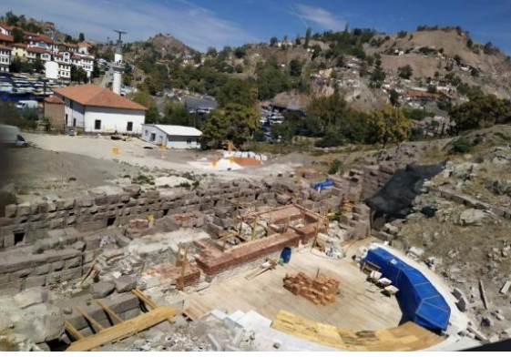
Şekil 8. Hıdırlıktepe Arkeolojik Sit Alanı Kazı Çalışması