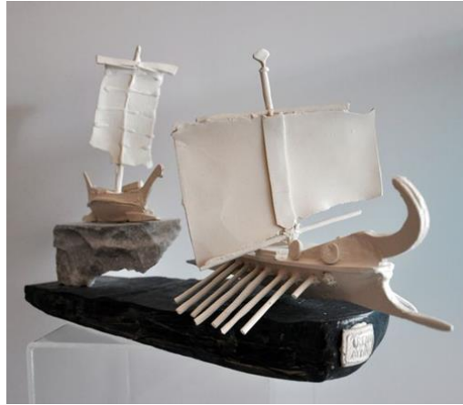
Görsel 14: İrfan Aydın, Porselen Gemiler Sersinden Görsel 15: İrfan Aydın, Porselen Gemiler Sersinden

Gemi kavramını çalışmalarında kullanan diğer bir sanatçı ise Zeynep Uysal Nurlu'dur. Nurlu, Hacettepe Üniversitesi Güzel Sanatlar Fakültesi Seramik ve Cam Bölümü'nü bitirmiştir. Baskı resim ve seramik ve alanlarında özgün üretimlerde bulunmaktadır. Görsel 20'de yer alan Bağlandık isimli çalışmasında Nurlu, antik dönem gemilerinden esinlenmiştir. Özellikle doğal iplerle iki gemi figürünün kendi içlerinden ve daha sonrasında birbirlerine bağlanması durumu sanatçının kendisi ve hayatında yer alan insanlar, olaylar, durumlar gibi tüm yaşanmışlıklarına bağlanma olarak tanımlanmaktadır. Antik dönemlerden esinlenen çalışmalarında sanatçı o dönemin seramik geleneğini yansıtmak amacıyla özellikle renk unsurundan kaçınmaktadır. Bağlandık isimli çalışmasında Nurlu, kalıpla üretimin yanı sıra seramiğe elle müdahalede de bulunmuştur. Ayrıca bu çalışmada özellikle dönemi refere etmek açısından artistik sınırlar eskitme etkisine odaklanılmıştır (Nurlu ile e-mail aracılığı ile görüşme).