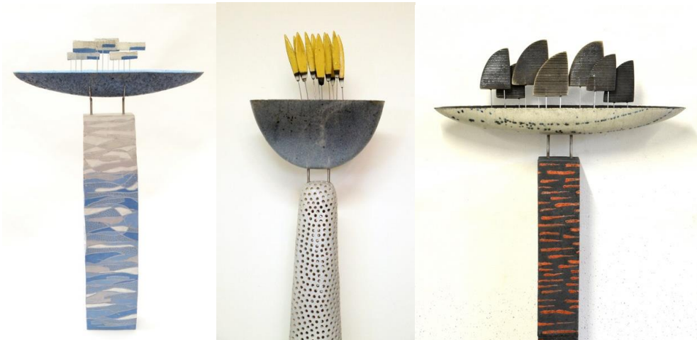
Görsel 9: Margreet Zwetsloot, Blue Ship, Seramik, 83x50x12 cm, 2017

Hollanda'nın doğusunda yaşayan ve çalışan, Margreet Zwetsloot yıllar boyunca, gençliğinin manzarasının özlemine çalışmaları için bir ilham kaynağı olarak kullandı. Onun çalışmalarında Hollanda manzarası, gemi, su, rüzgar, bulutlar, hareket gibi temalar bu nostaljiyi temsil eder. Son yıllarda fizik ve astronomiye olan ilgisi de onun çalışmalarında önemli bir hale geldi. Sanatçı günümüzde maddenin farklı durumları: katı, sıvı, gaz, entropi ve zaman oku gibi olgular üzerinde çalışmaktadır. Margreet Zwetsloot Görsel Sanatlar Akademisi Utrecht, Görsel Sanatlar Akademisi Amersfoort ve Görsel Sanatlar Akademisi AKI Enschede eğitimini tamamladı. Seramik eğitimcisi olarak, Utrecht Uluslararası Bağlama Classes El Sanatları öğretmenliği, Carmel Koleji Oldenzaal de El Sanatları/Sanat Tarihi öğretmeni ve Concordia Art ve Culture Enschede at Seramik öğretmenliği yapmasının yanı sıra sanatçı 2011 yılından bu yana kendi stüdyosunda serbest seramik sanatçısı ve eğitimcisi olarak çalışmaktadır (Url 3).