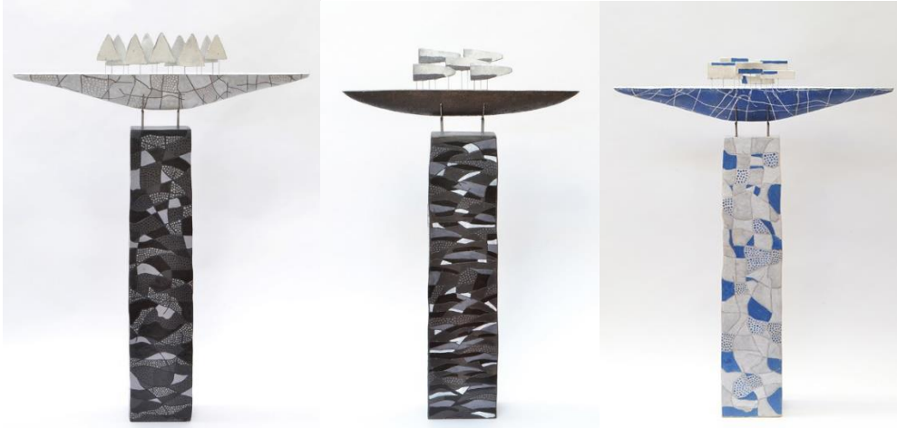
Görsel 6: Margreet Zwetsloot, White Ship Black Column, Seramik, 102x73x10 cm, 2017