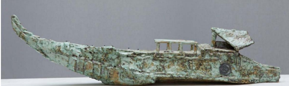
Görsel 18: Fatih Karagül, Trieme, 2010, U:67 Cm., Şamotlu Çamur Üzerine Bakırlı Alkali Sır, 1040 Derece Oksidan Pişirim. (Karagül, 2017: 52).

Fatih Karagül, tasarımlarında tema olarak gemiyi kullanmasının sebebini şu şekilde açıklamaktadır: “Öncelikle bir deniz kenti ve ülkesinde yaşamamla bağlantılıdır. Buna ek olarak yaşadığım coğrafyanın bünyesinde barındırdığı tarihi geçmiş, mitoloji ve arkeolojisinde sıklıkla gemilerin ele alınması, tema olarak gemi biçimini seçmemde etkili olmuştur. Biçimsel olarak yerel unsurların tasarım elemanı olarak yorumlanıp, ulusal ve uluslararası sanat etkileşiminde kendi kültürümüzü gemiler ile yansıtabilme, bir yöntem olarak benimsediğim bir diğer unsurdur. İlyada ve odesya da ele alınan gemiler, Çanakkale'deki gemicilik faaliyetleri ve geleneksel Çanakkale seramiklerindeki gemi biçimli lambalar, batının gemiler ile işgaline karşı koyan Nusrat figürü, kendi gemilerimi oluşturmada önemli esin kaynaklarıdır. Ayrıca gemiler hayata dair pek çok unsurun taşınmasında aracılık etmiştir. Batı uygarlığının şekillenmesinde Pek çok savaş, kültürel emperyalizm, soy kırımlar, salgın hastalıklar gibi olumsuz temaların da gemiler aracılığıyla yaşandığı gerçeğinden hareketle, bu duruma direnişin temelinde yine gemileri görmekteyiz. Aynı zamanda sanayi devrimi sonrası gelişen gemi inşa yöntemleri ile tasarım olarak da gelişimini sürdüren gemiler aynı zamanda romantik bir ayrılış ve varış hikayesidir de. Tüm bunlar bir araya geldiğinde tasarımlarımda kullandığım ve gelecekte de kullanmaya devam edeceğim sembolik bir figür olarak vaz geçemediğim bir tema olacaktır” (Aktr.Korkmaz, 2018:1532).