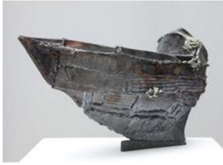
Görsel 16: Zeynep Uysal Nurlu, Bağlandık, Seramik, 25x60 cm, 2015