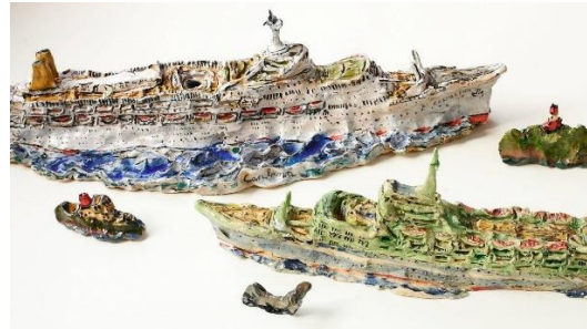
Görsel 5: Robert Rapson'un Seramik Gemileri