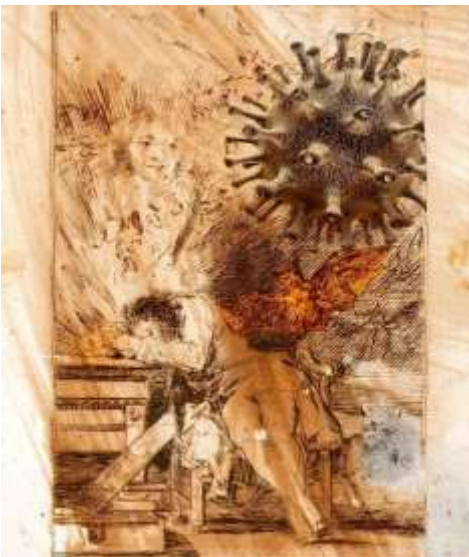
Görsel 11. Francisco Goya'nın hassas tasarımlarına gelince, virüs için farklı bir doku ve renk kullanılır, Ebrahim Haghghi