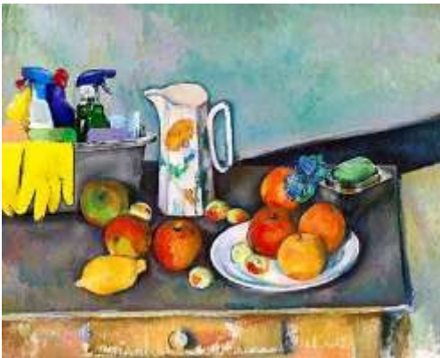
Görsel 8. Cézanne'nin cansız doğa resminde maske ve virüs izine rastlanmasa da, Cézanne'nin elmalarının ve tabakların yanına masanın üzerine konulan deterjan, sabun ve eldiven spreylere görülebiliyor, Ebrahim Haghighi

(Lady with an Ermin) adlı resminde Da Vinci, hanımın elinde bir hayvan tutuyor ve İbrahim Haghighi'ye göre korona hastalığının salgın nedeniyle ilgili bir habere göre bu hayvan, sert pullu bir karıncayiyene dönüştü (Görsel 9).