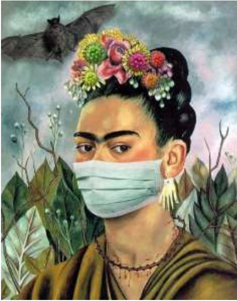
Görsel 4. Frida Kahlo'nun ağzına takılan cerrahi maskeler, Ebrahim Haghighi ( http://static3.honaronline.ir/thumbnail/J7x2F0gwc54h/jtaNacsFLTV38JAavdbCWNC2ghfdHRu-7r4h-Hr_UU_NdRng860Z9IC-gXbEsgfKGAhFxe_vrgz2PVA7xbaKxlULHF1KLKjjVvRAXqdxq3j6Bk-oQ9QC_ZQ,./%D8%AD%D9%82%DB%8C%D9%82%DB%8C.jpg )

Tanınmış bir sanat eserinin farklı bir temaya sahip bir eser yaratmak için kullanılmasının sanat tarihinde bir geçmişi vardır ve en bilinen örnekleri Francis Bacon'un Velasquez'in pop resmini kullanması veya Marcel Duchamp'ın Leonardo da Vinci'nin Mona Lisa'sına dayanan resmidir. Şimdi, İbrahim Haghighi, edebiyat endüstrisinde yaygın olduğu gibi, diğer sanatçıların eserlerini "memnuniyetle karşıladı" ve şiirleri biçiminde farklı şiirler yazdı. Bir çok eserinde orijinal resimde çok fazla değişiklik yapmamış ve bugünlerde sadece çok öne çıkan bir unsuru kullanarak tabloyu mevcut mekana ve koşullara yaklaştırmıştır. Frida Kahlo'nun ağzına takılan cerrahi maskeler (Görsel 4) veya Van Gogh çiftlik işçileri ağızlarında maskelerle dinlenen eserler arasında (Görsel 5).