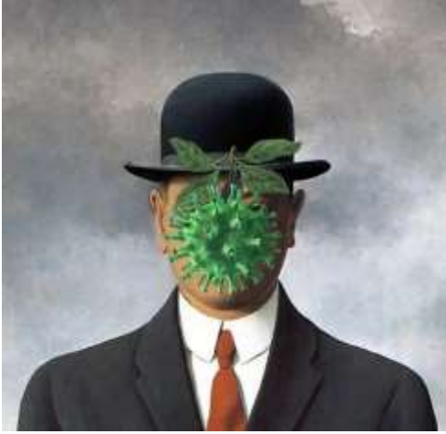
Görsel 6. Magritte resimlerinde erkeklerin yüzlerinin önüne yerleştirilen meşhur yeşil elma, Ebrahim Haghighi

Bir dizi başka çalışmada da Covid virüsü olarak tanıtılan form boyama alanına girdi. Magritte resimlerinde erkeklerin yüzlerinin önüne yerleştirilen meşhur yeşil elma, burada yeşil bir virüse dönüştü (Görsel 6). Ve Edward Munch'ın "Çılgılık" tablosunda, adamın köprüdeki korkutucu çılgınlığının nedeni, üzerinde gölge düşüren bir virüsün varlığıdır (Görsel 7).