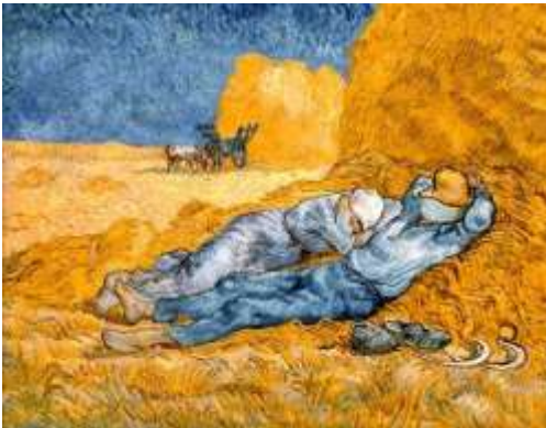
Görsel 5. Van Gogh çiftlik işçileri ağızlarında maskelerle dinlenen, Ebrahim Haghighi