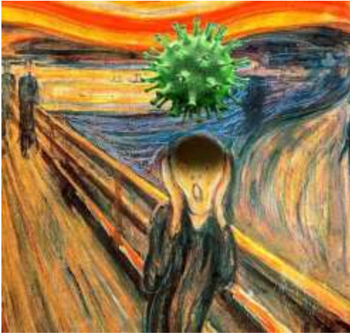
Görsel 7. Edward Munch'ın "Çılgılık" tablosunda, adamın köprüdeki korkutucu çılgınlığının nedeni, üzerinde gölge düşüren bir virüsün varlığı, Ebrahim Haghighi ( http://golestangallery.com/fa/GolestanGallery-GalleryDetail.aspx?exid=464&id=8296&wn=14 )

Ancak bu koleksiyondaki en farklı eserler Cézanne ve Da Vinci'nin tablolarıyla ilgilidir. Cézanne'nin cansız doğa resminde maske ve virüs izine rastlanmasa da, Cézanne'nin elmalarının ve tabakların yanına masanın üzerine konulan deterjan, sabun ve eldiven spreylere görülebiliyor (Görsel 8).