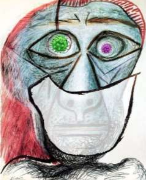
Görsel 10. Picasso'nun Kübist yüzündeki maske, resimdeki ile aynı basit çizgilerle çizilir, Ebrahim Haghghi

Bu çalışmalarda dikkat çeken bir nokta, resimlere yeni bir unsur katmak için orijinal resimlerin üslubuna sadakat olmuştur ve resimlerin orijinal üslubüne sadık kalmışlar. Picasso'nun Kübist yüzündeki maske, resimdeki ile aynı basit çizgilerle çizilir (Görsel 10) ve Francisco Goya'nın hassas tasarımlarına gelince, virüs için farklı bir doku ve renk kullanılır (Görsel 11).