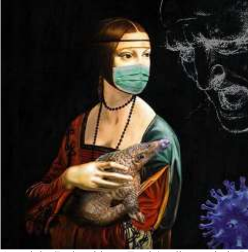
Görsel 9. (Lady with an Ermin) adlı resminde Da Vinci, hanımın elinde bir hayvan tutuyor ve İbrahim Haghghi'ye göre korona hastalığının salgın nedeniyle ilgili bir habere göre bu hayvan, sert pullu bir karıncayıyene dönüştü, Ebrahim Haghghi

Bu çalışmalarda dikkat çeken bir nokta, resimlere yeni bir unsur katmak için orijinal resimlerin üslubuna sadakat olmuştur ve resimlerin orijinal üslubüne sadık kalmışlar. Picasso'nun Kübist yüzündeki maske, resimdeki ile aynı basit çizgilerle çizilir (Görsel 10) ve Francisco Goya'nın hassas tasarımlarına gelince, virüs için farklı bir doku ve renk kullanılır (Görsel 11).