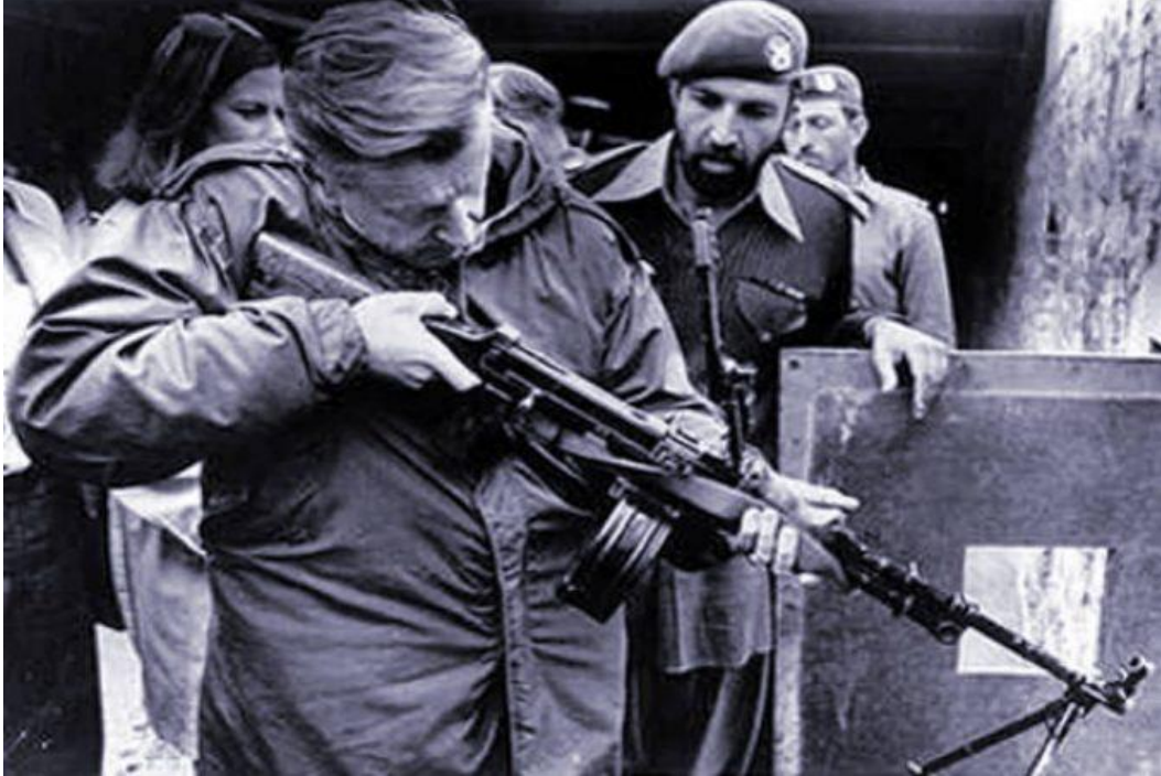
Şekil 2: Brzezinski-Usame Bin Ladin

Sovyet'lerin Afganistanı işgal ettiği süreçte, Afgan savaşçıları olarak isimlendirilen İslamcı örgütler: Talibanlar ve El-Kaide olarak isimlendiriliyordu. El-Kaide lideri Usame Bin Ladin ile ABD'nin o zamanki Ulusal Güvenlik Danışmanı olan Brzezinski'nin silah ile fotoğrafı; ABD'nin Sovyetlere karşı El-Kaide'ye verdiği desteğin ispatıdır.