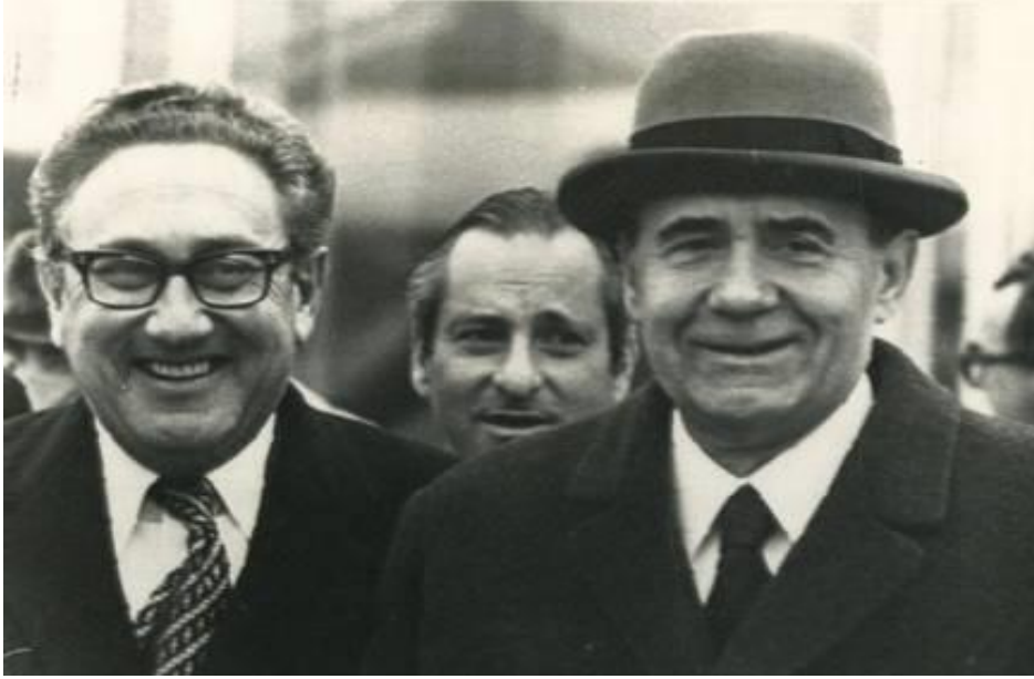
Şekil 3: Henry Kissenger-Andrey Gromiko (22-Ekim-1973)

ABD Dışişleri Bakanı Henry Kissenger, Sovyetler Birliği Dışişleri Bakanı Andrey Gromiko ile beraber iki kutuplu dünyada düşman devletlerin aralarındaki buzların eridiğinin bir kanıtıdır.