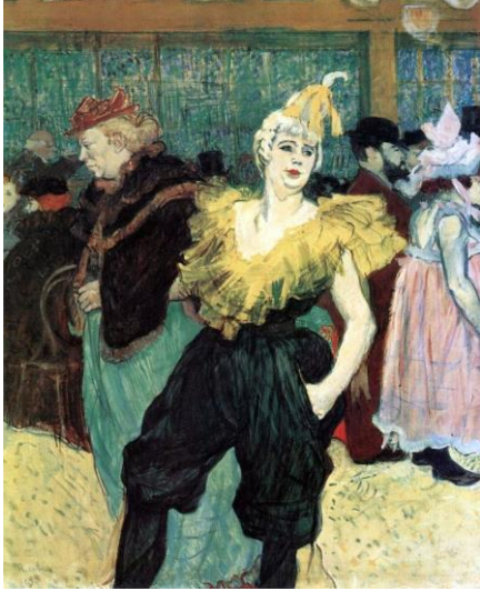
URL- 3: Palyaço Kadın Cha U Kao, 1895

Lautrec'in 1887-88 yılında yaptığı "Fernando Sirkindeki Hokkabaz Binici" adlı eserinde URL- 2'de Fernando sirkindeki at resminin bilinen kompozisyon kurallarından farklı olduğu görülmektedir. Sanatçının ışıktan çok kendi oluşturduğu renk olgusuyla derinliğe ulaştığı görülmektedir. Eserler ne realist ne de güçlü empresyonist bir üsluba sahiptir. Eserde renk ve kompozisyonu farklı açılardan oluşturmuştur. Resimdeki at figürü, resmin sağ alt köşesinden ortasına kadar kırmızı bir bariyerle çevrelenmiştir. İki asimetrik parçanın resmin merkezine doğru hareket ettiği görülmektedir. Resmin solunda duran figür resmin sağına kadar hareket eder ve kırbacını resmin ortasına yerleştirmiştir. Lautrec' in kompozisyonundaki konu ve eskiz seçimi oldukça heyecan vericidir.