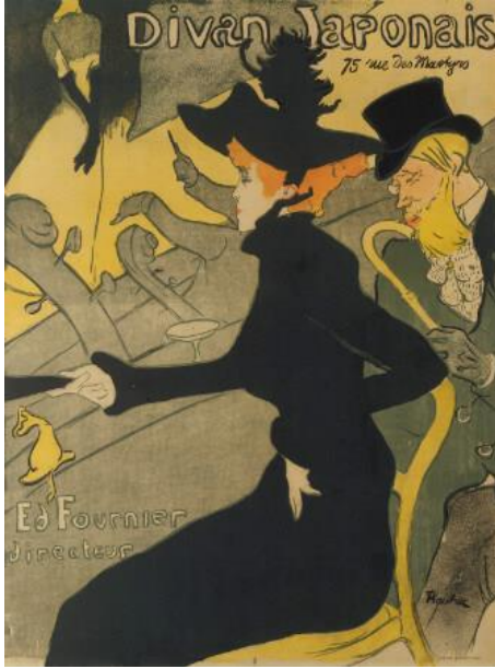
URL- 7: Le Divan Japonais, 1893

Lautrec'in 1892 yılında yaptığı "Reine de Joie" afişi URL- 6'da görülmektedir. Afişte, iki figür ayrıntılı olarak tasvir edilmiştir. Güzel giyimli bir kadın olan Renei de Joie, bir yemek masasında çirkin ama zengin bir adamın burnunu öpmektedir. Diğer afiş tasarımlarında olduğu gibi mekân sade bırakılmıştır. Arka plan sıcak renklerden oluşmaktadır (Arnold, 1987: 34). Fon renginde kullanılan sarı, sürahinin sarısı ile uyum sağlayarak sarının yoğunluğunu azaltmıştır. Işık gölge oyunları ve derinlikten vazgeçilmiştir. Üç temel rengin kullanıldığı görülmektedir. Güçlü sarı, kırmızı ve siyah kullanıldığı afişte, hanımefendi insanların dikkatini çeken kırmızı bir elbise giymiştir. Eser üzerinde mekânın tanıtımını yansıtan tipografi afiş tasarımına hareket kazandırmıştır.