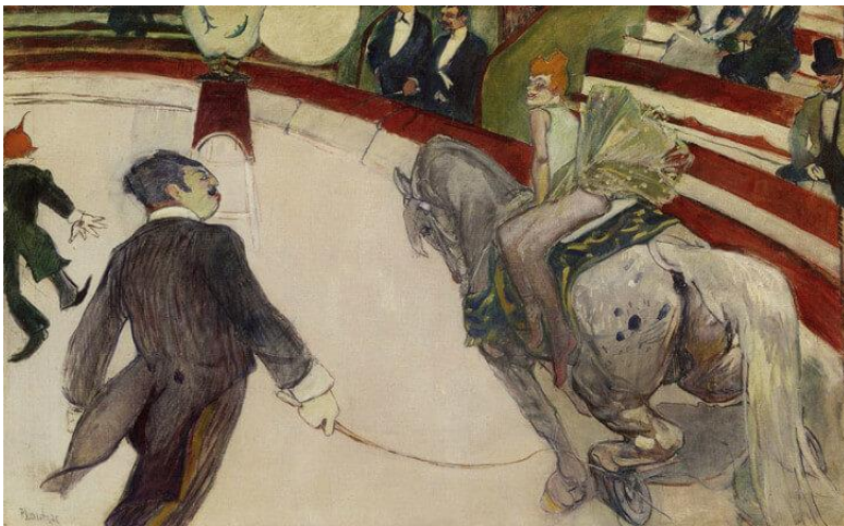
URL-2: Fernando Sirkindeki Hokkabaz Binici, Tüyb, 103,5x161, 1887-88

Lautrec'in 1896 yılında yaptığı "Tuvalet Masası" adlı eserinde (URL- 1) sıcak renklerin ilişkisi temel alınarak kurgulanan kompozisyonda, figürdeki sıcak sarı rengi ve ten rengini kullanarak ön plana çıkarmıştır. Figür kompozisyonun tam merkezinde yer almaktadır. Kompozisyonda ön-arka ilişkisi daha belirgindir. Resimde ağırlıklı olarak sarı ve sarının tonları kullanılmıştır. Kırmızı değerler tamamlayıcı unsur olarak resmi rahatlatmıştır. Eserdeki parlak renklerin kullanımı ve formların duygusal ifadesi, kompozisyonun zenginliği ile ifade edilmiştir. Bu tabloya bakan sanat izleyicileri, tasvir edilen kişi ya da nesneye birebir benzerlik kurmanın imkânsız olduğunu kabul etmek durumundadır.