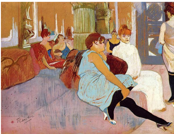
URL- 4: Moulins Caddesi'ndeki Salon, Tüyb, 111,5x132, 1894

Lautrec'in kadın portrelerine birkaç açıdan bakabiliriz: Kadınları sıradan pozlarda tasvir etmiştir. Lautrec, bu geleneksel portrede bile canlı bir atmosfer oluşturmayı başarmıştır. Sanatçı, diğer kadınları, Montmartre çevresindeki kadınları ve hatta kimliği belirsiz genç kızları eleştirel bir bakış açısıyla resmetmiştir (Arnold,1987: 134). "Lautrec'de durum, sanatsal yaratı gücünün verdiği cesaretle beklenenin aksine çevrilmiştir. Hareketin, hareketlinin ve kıvrak çizginin ustası Lautrec'in, çizgisi o denli kesin, o denli kendine özgü bir sıçrama, durma, ilerleme ve ileri geri sürme ritmine ulaşmıştır ki litografileri, gravürleri, imzasızdır"(Çığır,2012: 57).