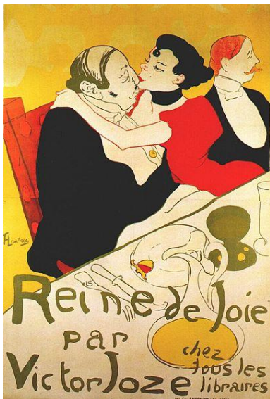
URL- 6: Reine de Joie, Renkli Taş Baskı, 136,5x93, 1892

Lautrec'in 1891 yılında yaptığı "Moulin Rouge - La Goulue" URL- 5'de afişi görülmektedir. Afiş tasarımında eğlence ortamı tasarlanmıştır. Tüm karakterlerin ana hatları çizilmiştir. Figürler daha sade ve detaydan uzak bırakılmıştır. Bu afiş tasarımında Lautrec, sol alt kısımdaki boşluğa kendi el yazısı ile farklı tipografik karakterlerle metni yazmıştır. Kendisi için tasarladığı logoya sol alt köşede yer vermiştir. Kompozisyonda derinliği geri planda siyah siluet şeklindeki figürlerle sağlamıştır. Ayrıca renkleri üçe indirerek sadeleştirdiğini görmekteyiz. Renkler turuncu, sarı ve siyahtır. Renk, hareketler ana ve alt yazıların boyutuyla uyumludur. Öndeki figürler kompozisyonun odak noktasını oluşturmaktadır. Afiş, tasarımı tipografik açıdan da çağdaş afiş tasarımına öncü niteliktedir.