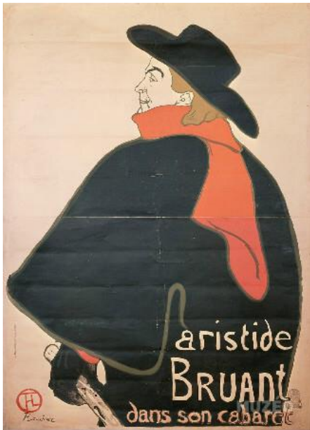
URL- 8: Aristide Bruant Dans Son Cabaret, 1893

Lautrec'in 1893 yılında yaptığı "Le Divan Japonais" afişi URL- 7'de görülmektedir. Lautrec, gölgesiz bir yaklaşımla siyahın yoğunluğuna dikkat çekmektedir. Afişte, ayrıntılı olarak iki figür tasvir edilmiştir. Afiş tasarımındaki karakter tasvirleri, eğlenceye gelmiş temalarını vurgulamaktadır. Oturan bayan figürü afişin tam ortasında yer almaktadır. Bazı figürler stilize tonda çizilirken, dış kısımlar kontörlerle belirginleştirilmiştir. Figürlerin vücut bölümleri ana hatlarıyla çizilmiştir. Arka plandaki gri tonlarda oluşturulan belirli belirsiz figürler sayesinde perspektif oluşturmuştur. Afişte metin, resim öğeleriyle birlikte kullanılmıştır. Yazı karakteri özgün yazı tekniği figürlerde olduğu gibi kontrollü olarak kullanılmıştır. Bu kullanım şekli ile afişte tipografi ve görseller birbiriyle uyumlu hale getirilmiştir.