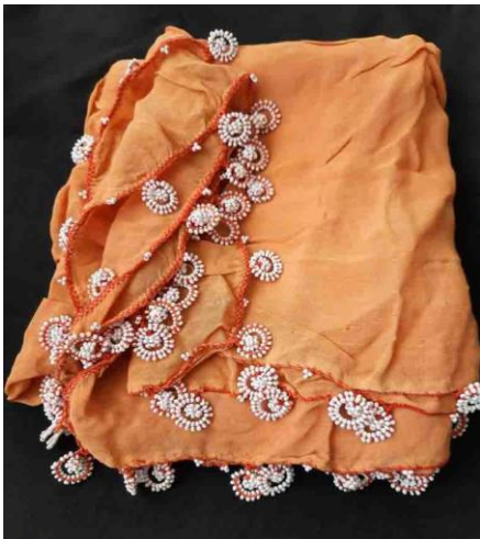
Fotoğraf 18 a. Salyangoz Çiçeği Oyası Kaynak Kişi: Hamide YENİLMEZ

Kenarları sürfile tekniği ile temizlenen beyaz tülbent üzerine yapılan yelpaze oyasında yeşil renk kum boncukları ve beyaz pamuk ipliği kullanılmıştır. Oyanın yapımında zincir, çift ilmek ve sık iğne teknikleri ile oluşturulan motifler eşit mesafelerde, aralıklı tekrar yöntemi ile yerleştirilmiştir. Kompozisyonda motifler figürsel bezeme ile yapılmıştır.