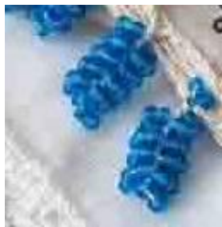
Fotoğraf 6 b. Dut Oyası Detay