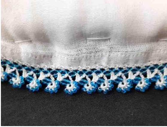
Fotoğraf 7 a. Elti Eltiye Küstü Oyası Kaynak Kişi: Nebihe YENİLMEZ

Dut oyası beyaz tülent üzerine mavi, beyaz ve siyah renkli kum boncuklar kullanılarak, beyaz pamuk ipliği ile yapılmıştır. Tülent kenarlarına oyanın taban kısmı sürfile tekniği ile oluşturularak üzerine zincir ve sık iğne teknikleri ile dut motifleri işlenmiştir. Kompozisyonda bitkisel stilizasyon kullanılarak dut motifleri eşit mesafelerde, aralıklı tekrar şeklinde yerleştirilmiştir.